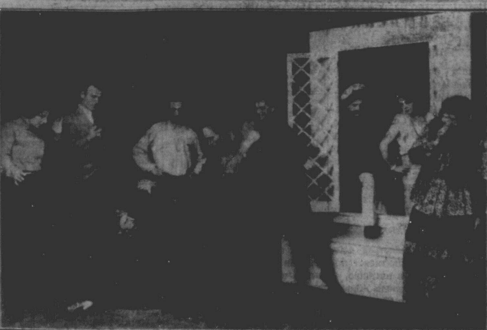
СЦЕНА З ДРАМИ "ЗЛИВА", ШО П ДРАМСПІВГРУПОК ВИДОГРАЄ В УКРАЇНСЬКІМ РОБІТНИЧІМ ДОМІ У ВІННІПЕГУ В СУБОТУ, 7-ГО ЛЮТОГО.