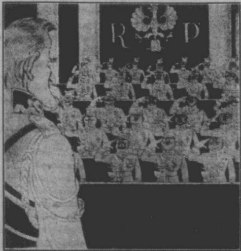
ЗАСІДАННЯ ПОЛЬСЬКОГО СОЮМУ.

Ще одна й про що тайну знають лише "люди з тверезою думкою", а робітникам і фермерам не скажуть. Драпака.