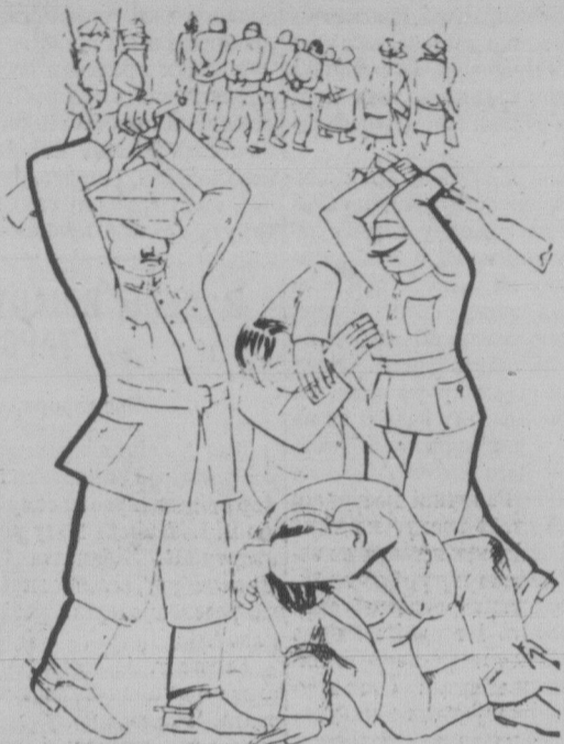
КАРНА ЕКСПЕДИЦІЯ В СЕЛІ НА ЗАХІДНІЙ УКРАЇНІ.

У такий спосіб знищено всі просвіти в Коломийському повіті, що були в руках робітничо-селянської лівиці. Число сіл, які на власній шкурі випробували карних експедицій пілсудчини, сягає 800. Протягом цієї "пацифікаційної" акції, за повідомленням офіційного фашістського "Кур'єра Краківського", арештовано 342 осіб. Справді, на самій лише Волині арештовано понад 600 та ще в Луцькій в'язниці, де перше перебувало 80 політ-