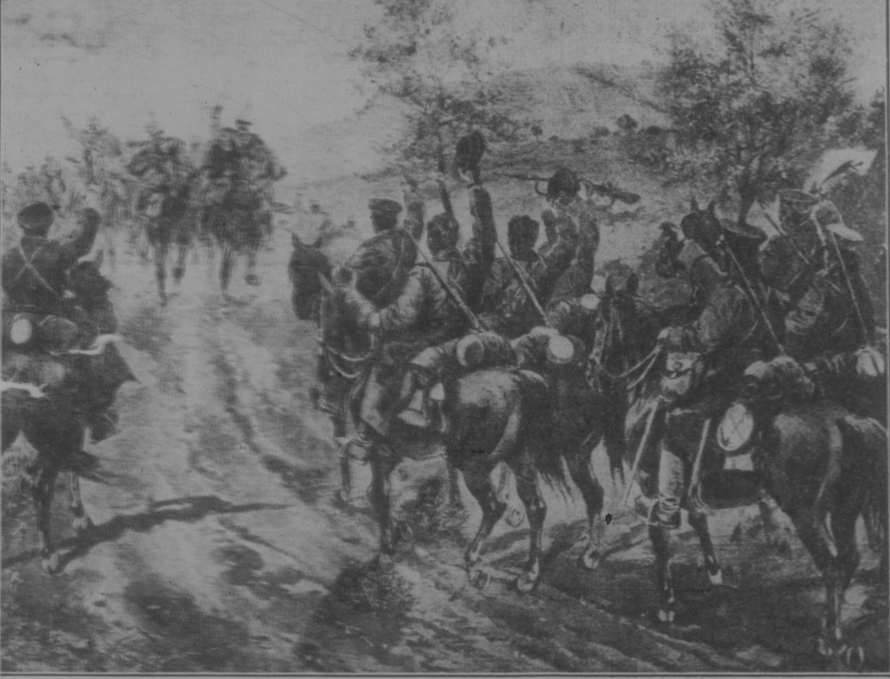
Die Vereinigung der österreichisch-ungarischen und deutschen Truppen mit der bulgarischen Armee.