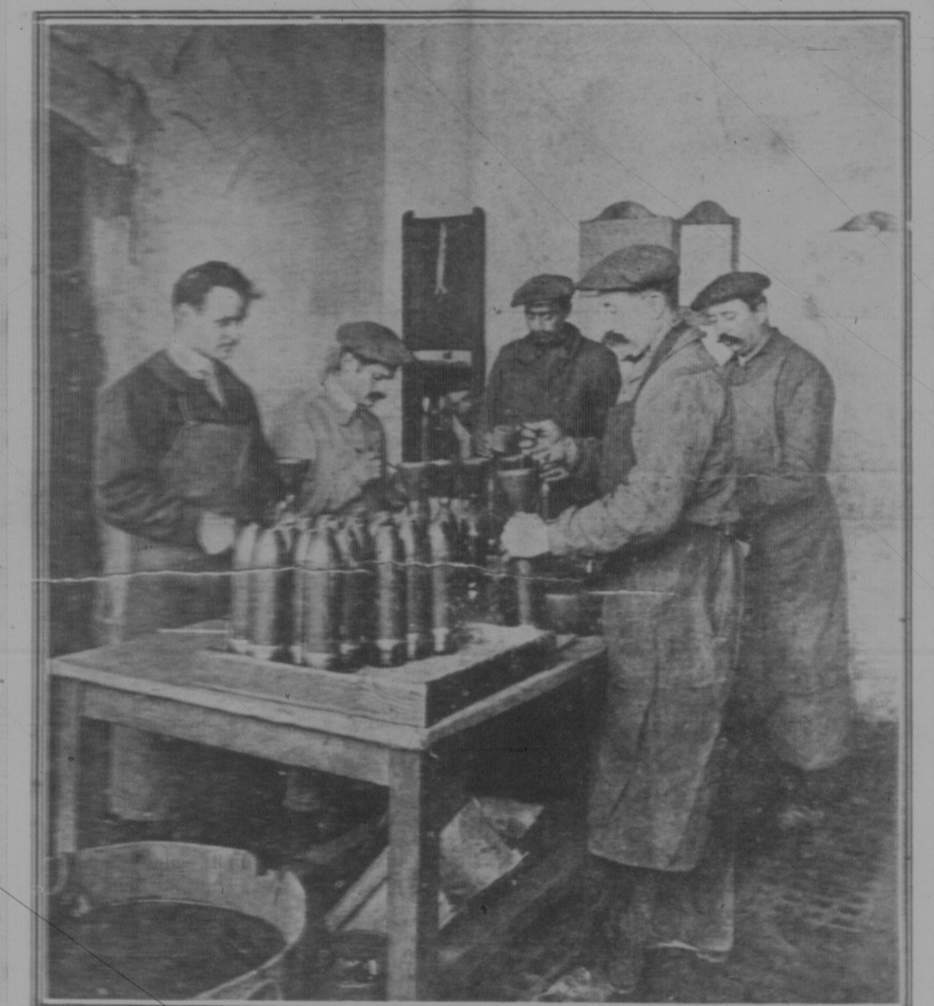
Fabrik der Geschosse mit „Zeritrotol“, einer dickflüssigen braunen Masse

Die Arbeiter in der Munitionsfabrik arbeiten an der Herstellung von Geschossen. Sie verwenden eine dickflüssige braune Masse, die als „Zeritrotol“ bezeichnet wird.