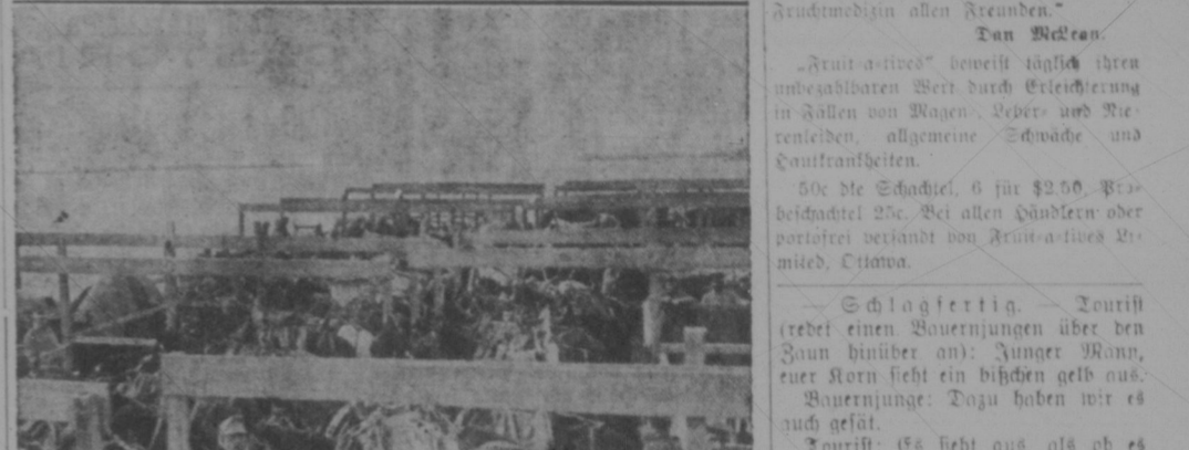
Vom Balkankriegsschauplatz: Truppen-Transport auf einer Revorata nach Serbien.

Das Schicksal der Seele. Ein Artikel über das Leben nach dem Tod. Er bespricht die verschiedenen Theorien über das Jenseitsleben und versucht, die Wahrheit zu ergründen. Die Seele ist ein unvergängliches Wesen, das über den Körper hinaus existiert.