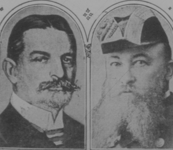
Der neue und der zurückgetretene deutsche Marine-Minister