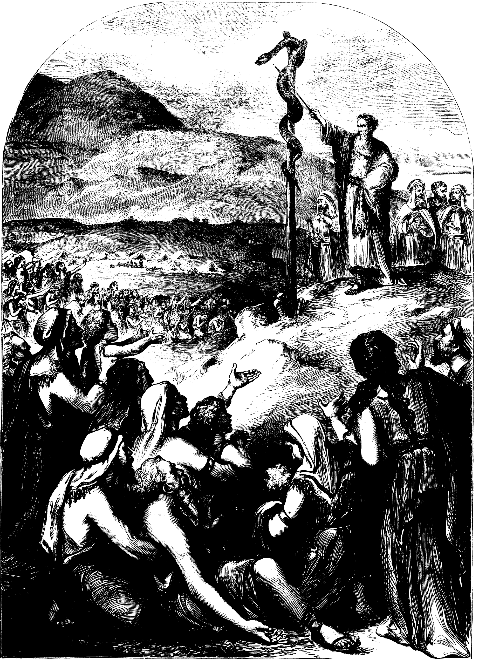
MOISE ET LE SERPENT D'AIRAIN DANS LE DÉSERT