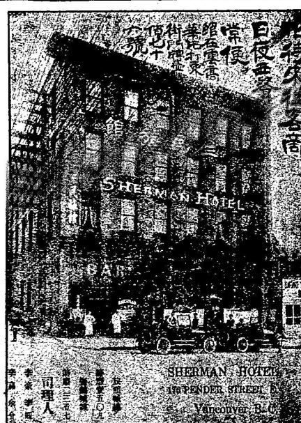
SHERMAN HOTEL 110 PENDER STREET VANCOUVER, B. C.