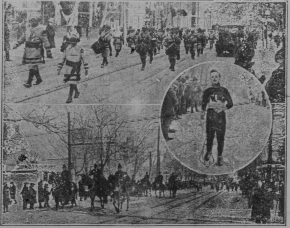
Oben: 2000 Schneeschuhläufer, welche aus allen Teilen Canadas und der Vereinigten Staaten in Quebec zusammengekommen waren.

Im Vorraum haben schließlich noch einige Dinge Ausstellung gefunden, die insbesondere den philatelistischen Sammler interessieren.