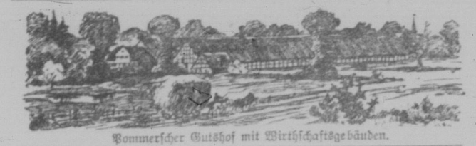
Sommerlicher Gutshof mit Wirtschaftsgebäuden.

Strümpfe und Mieder, die mit vielen kleinen silbernen Plättchen und sonstigen Schmuck geziert sind. Die vollständige Feiertracht einer Bäuerin soll über sechshundert Mark an Werth haben. Doch vor der alles gleich machenden neuen Zeit verschwindet auch die Volkstracht des Weiswunders. In den größten Theile Pommerns ist überhaupt von einer Volkstracht keine Rede mehr, und der einfache bürgerliche Tagelöhner erscheint bei feierlicher Gelegenheit (Kirchgang