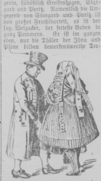
Weizacker-Bauern im Sonntagsgaun.

calmeinschnitte. Unabsehbar breiten sich hier die üppigsten Getreidefelder aus, selbst die in der norddeutschen Tiefebene sonst so zahlreichen erratis- schen Blöde fehlen hier, so daß die bei- den Hauptorte des Weizadens, Star- gard und Wryth, nicht einmal durch eine Chaussee haben verbunden werden können und im Winter bei fast grund- losen Wegen der Verkehr fast aufhörte. Im Sommer sind dafür diese weiz- aderschen Wege so fest und eben, wie