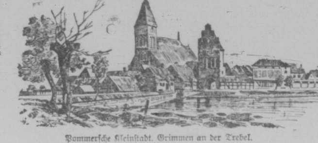
Pommerische Kleinstadt. Grimmen an der Trebel.

Pommern geht es in mancher Beziehung, wie es Medienburg, vor dessen geistiger Entdeckung durch Frey Reuter, erging: man machte sich im übrigen deutschen Vaterlande ganz falsche Vorstellungen davon.