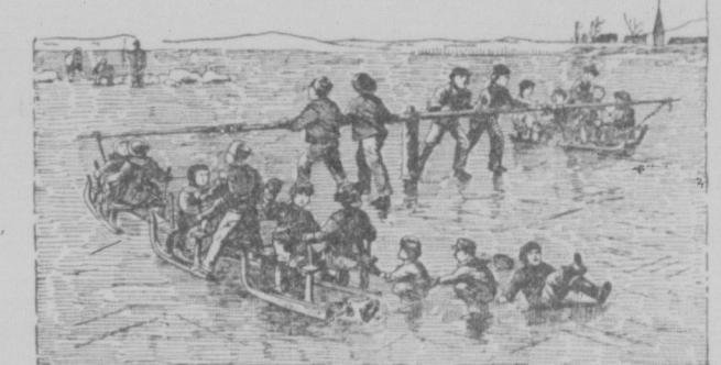
Eisbarockel in Pommern.

kommt nur einmal nach unseren pommerischen Seebädern und nun gar nach der Perle des Nordens, nach Rügen! Ihr würdet Euch Urkehl bald genug ändern und bald wiederkommen.