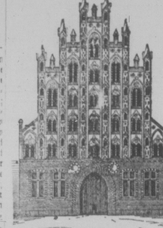
Gauß zu Greifswald.

Jomander Bauern im Sommerhaat. Pommern zerfällt in zwei Hälften, die von der Ostsee geteilt werden, westlich des Stromes Vorpommern mit dem nordwestlich gegen Medienburg vorgezogenen Distrikt Neuvorpommern, östlich der Ostsee Hinterpommern.