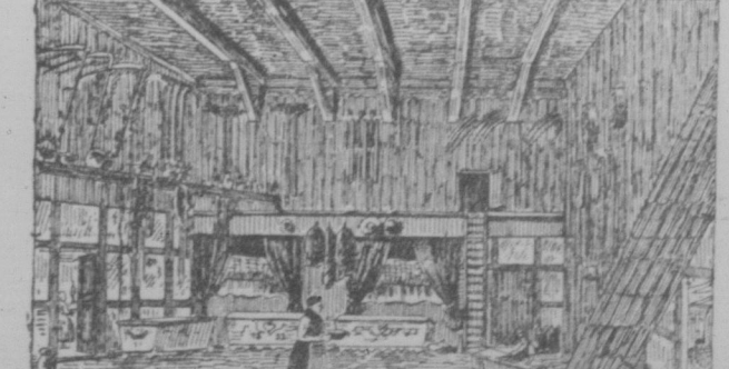
Tenne eines Jomander Bauernhauses.

wenige Reste ganz deutsch geworden. Pommern ist in den letzten 15 Jahren ein Hauptauswanderungsland für Amerika geworden.