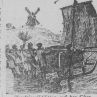
Wachsegelschiffen auf der Ostsee.

aber er verbindet mit einem sehr klaren Verstande Gründlichkeit, Fleiß, Beharrlichkeit und einen unverwundlichen Humor. Die christlichen Sätze Frey Reuters, welche durch seine Übersetzungen überall in Deutschland bekannt geworden sind, sind zum geringsten Teil seine eigene Erfindung; er hat sie in einer medienburgischen Vorpommerschen Heimath, wo sie von Mund zu Mund gingen, aufgefunden und ihnen die poetische Gestalt gegeben.