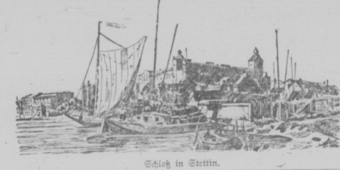
Schloß in Stettin.

Geld auf verbessertes Formvermögen zu verleihen mit gleichzeitiger übernehmender Lebensversicherung. Wir stellen gewöhnliche Policen aus. Vergleichlichen Limes Element und Annuity Policen. Große hoch, Ausgaben keine. Netto-Ein- kommen für die Versicherten hoch in Rücksicht auf die Profite. Wegen näherer Einzelheiten wende man sich schriftlich oder persönlich an un- sere Local-Agenten in Regina: P. M. Bredt & Sohn.