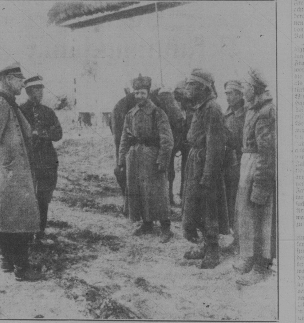
In einem Grappenort auf dem östlichen Kriegsschauplatz. Verhöre gefangener Russen durch den Grappenkommandanten.

Die politische Lage in Südamerika — Die politische Lage in Südamerika ist in der letzten Zeit sehr unruhig. Die politische Lage in Südamerika ist in der letzten Zeit sehr unruhig.