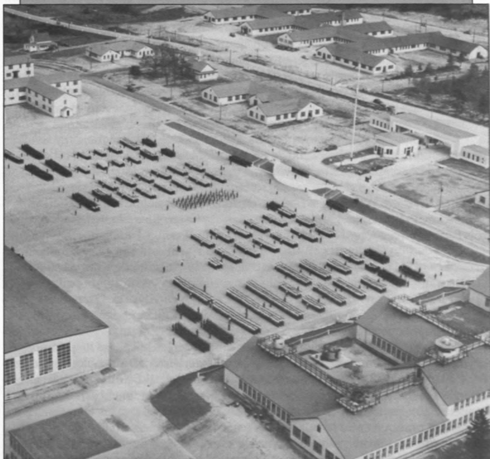
Figure 3 : Observation des défilés militaires et notification

L'annonce des défilés militaires, surtout si elle est complétée par des inspections aériennes et terrestres, constitue une mesure peu « intrusive » à caractère coopératif, qui serait sans doute utile aux fins de la vérification des effectifs en personnel.