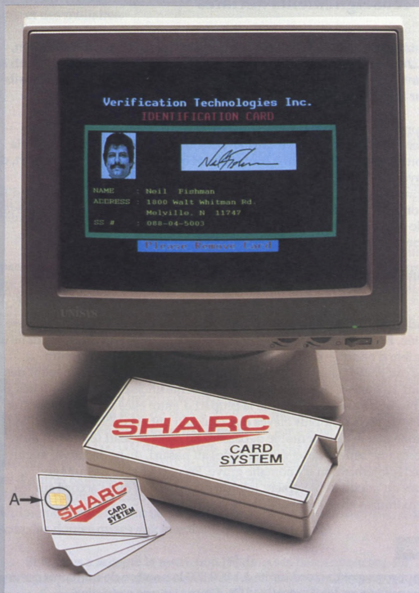
Figure 4 : «Des cartes intelligentes»

Les cartes dites «intelligentes» ressemblent à une carte de crédit; elles renferment un microprocesseur (A) possédant une capacité de mémoire suffisante pour stocker beaucoup d'informations, y compris la photographie, la signature et les empreintes digitales du détenteur, ainsi que son numéro matricule, son grade et d'autres données personnelles le concernant.