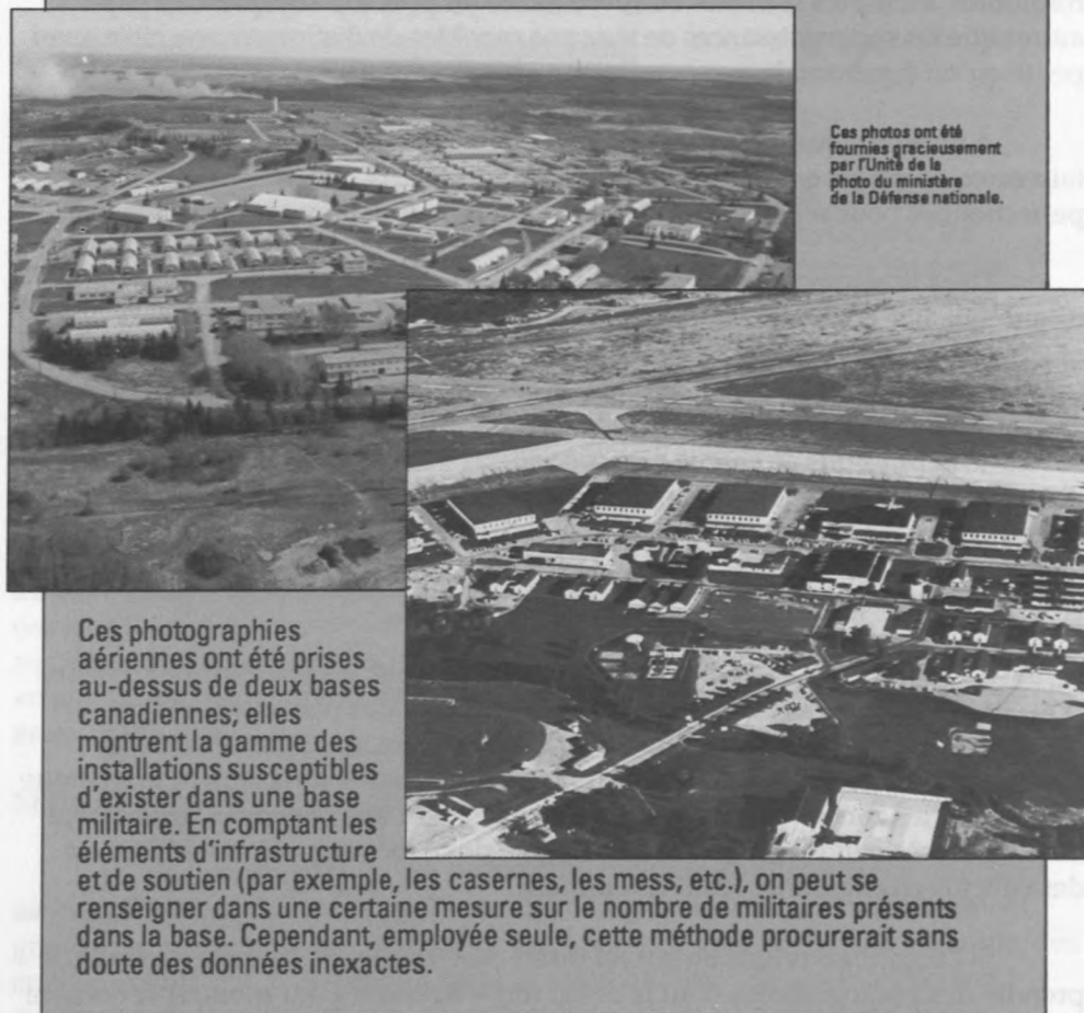
Figure 1 : L'infrastructure des bases : un moyen de vérifier les effectifs en personnel militaire

maximum cet aspect contestable de la vérification, il conviendrait sans doute d'employer des capteurs automatiques installés au sol pour exécuter le plus de travaux de vérification possible et réduire au minimum le nombre d'inspecteurs effectivement nécessaires. Ajoutons ici que les capteurs automatiques ne semblent pas dans l'ennui; ils ne sont jamais distraits et ils recueillent seulement l'information qu'on les a instruit d'obtenir. Mais il existe un danger : la partie visée par l'inspection réussira peut-être à les désactiver pendant qu'elle mène des activités qu'elle souhaite dissimuler. Disons, à cet égard, qu'aux fins de la vérification du Traité sur la non-prolifération et du Traité sur les FNI, on avait mis au point des capteurs in situ et que l'on avait trouvé des moyens de les prémunir contre pratiquement toute manipulation, de sorte que les inspecteurs pourraient détecter toute tentative d'altération.