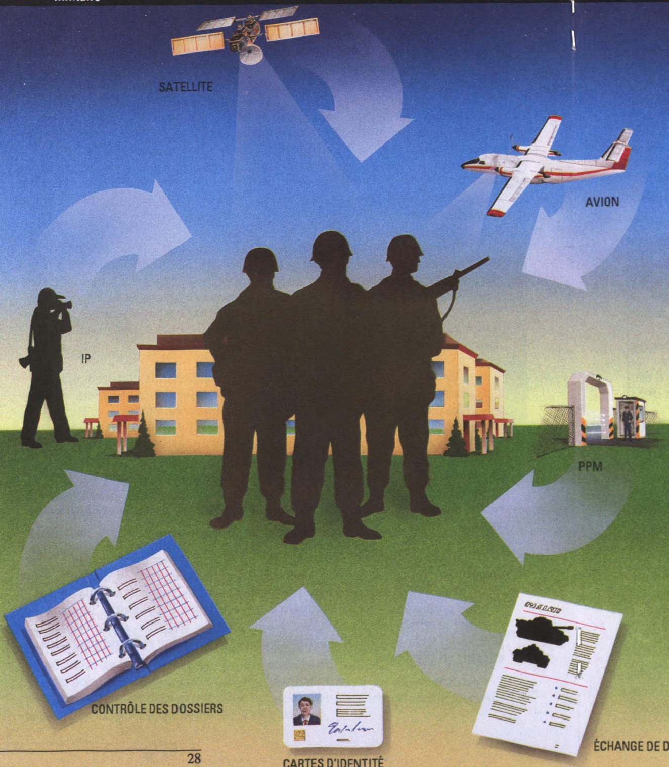
Figure 2 : Une méthode à plusieurs volets pour vérifier les effectifs en personnel militaire