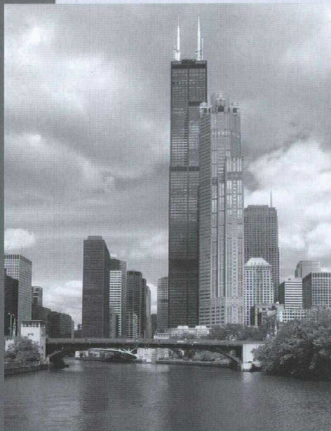
L'incomparable tour Sears, située en plein cœur du quartier des affaires de Chicago.

Chicago est le cœur des affaires des États-Unis. Elle est la 3 e ville en importance aux États-Unis (derrière Los Angeles et New York) et compte 9,1 millions d'habitants. Ville affairée, où les journées n'ont que 24 heures comme ailleurs, ses deux aéroports gèrent 3 200 vols par jour, soit 88 millions de passagers par an! Elle a tout : théâtres, architecture de premier ordre, équipes sportives professionnelles, festivals, sites historiques, collections d'œuvres d'art exceptionnelles, attractions naturelles et artificielles, et bien plus encore.