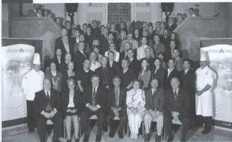
La délégation canadienne pose pour une photo de groupe lors de la 2 e mission d'Équipe Canada Atlantique à Chicago.

Chicago, Illinois > Équipe Canada Atlantique (ECA), fruit d'un partenariat entre des ministères fédéraux et les quatre provinces de l'Atlantique, a organisé en octobre une mission commerciale très réussie sur le marché du grand Chicago. Cette mission fait suite à une 1 re mission qui s'était déroulée en avril 2005 et qui avait également remporté beaucoup de succès.