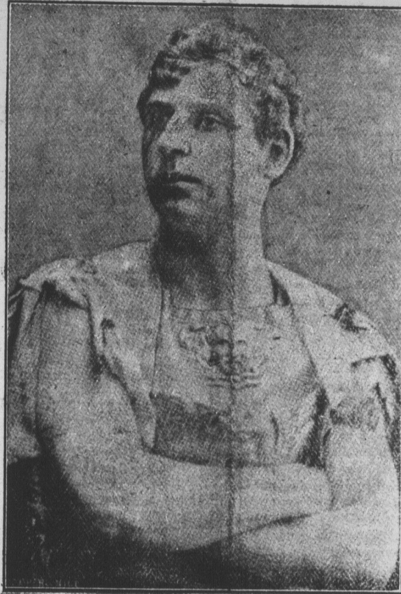
M. JEAN RIDDEZ, Baryton de l'Opéra de Paris, dans le rôle de Vinicius , qui chantera à Edmundston, dans la salle du théâtre "Star" le mercredi soir, 18 mai courant, sous les auspices des Chevaliers de Colomb.