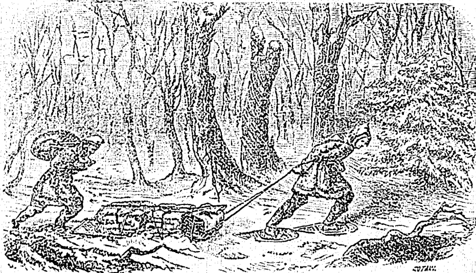
Le Coupeur de Bois.

M. de Frontenac, vicillard d'une rare vigueur, n'y alla pas de main morte, on le voit, à l'égard des coupeurs de bois, mais il fit plus de bruit que de mal, parce qu'il se sépara de l'évêque, le digne M. de Laval, dans la question de l'eau-de-vie, et surtout un commerce qui était évidemment la cause de tous les abus. Je sais qu'une terrible concurrence était survenue, celle des Anglais, et que non-seulement ils offraient partout de l'eau-de-vie comme nous, mais qu'ils la vendaient même à meilleur marché; nous avions, il est vrai, d'autres marchandises auxquelles les sauvages s'étaient accoutumés et qui pouvaient le remplacer avec avantage dans le commerce. L'eau-de-vie, on ne saurait trop le répéter, était la ruine des mœurs, et les coupeurs de bois ne savaient que