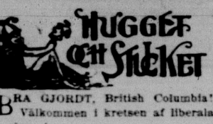
BRÄ GJORDT, British Columbia. "Välkommen i kretsen af liberala provinser!"

de dock vara, att en opartisk historik skrivare icke kan kastat det ansvaret på svenska nationen, som Mani- toha Free Press önskar. Om äfven några få "Preussers", kan väl i rim- lighetens namn icke hela den svenska nationen anklagas för en dylik beund- rande. Den opartiske historikskrifvare skall kanske äfven finna, att folk, som bedja gud bevara sig för preus- ser, hemfallit åt det dylika, som i vidrighet icke står långt efter det från Tyskland stammande.