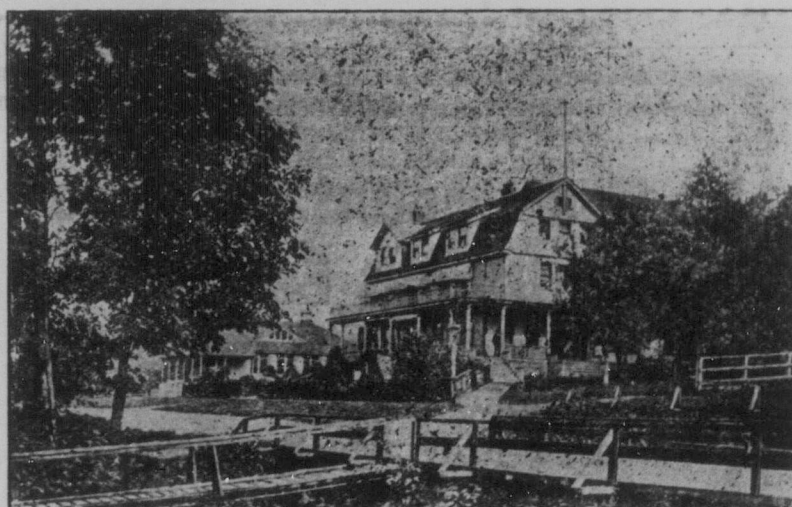
NORTH VANCOUVER HOTELL, NORTH VANCOUVER, B. C.

Rekommenderas i landsmännens benägna åtanke