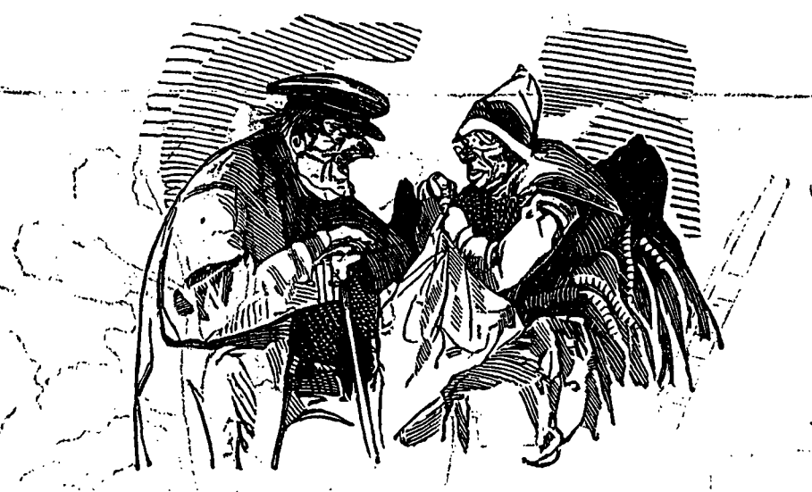
MACHINE A COUDRE.

L'ahurissement du père Roubilloux fut tel qu'il ne put échapper le morceau de pain, lequel tomba dans la rivière et disparut dans les roseaux. Du coup, le père Roubilloux transforma son mémoire en volume, et lui donna