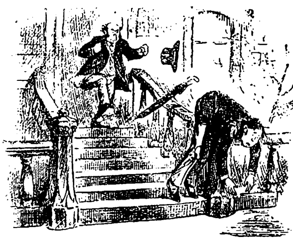
Dépression subite et cyclone.