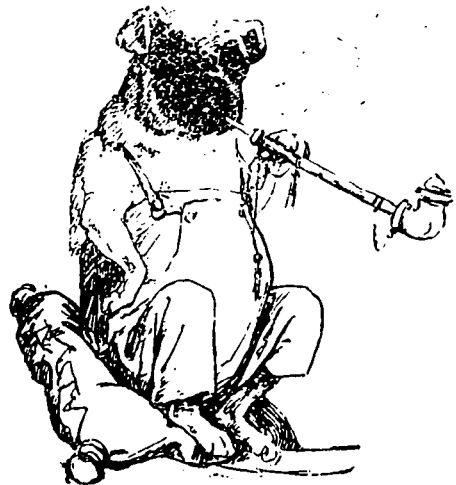
Charmante, la canicule cette année.

Un étudiant consulte un diseuse de bonne aventure. —Vous serez pauvre jusqu'à l'âge de trente ans, lui dit la nécromancienne. L'étudiant pousse un soupir de satisfaction en songeant à la dernière partie de sa carrière. —Et après ? demande-t-il. —Après vos trente ans, vous serez accoutumé à l'être.