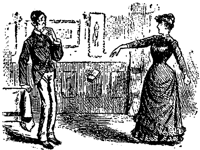
Variable à l'orage.