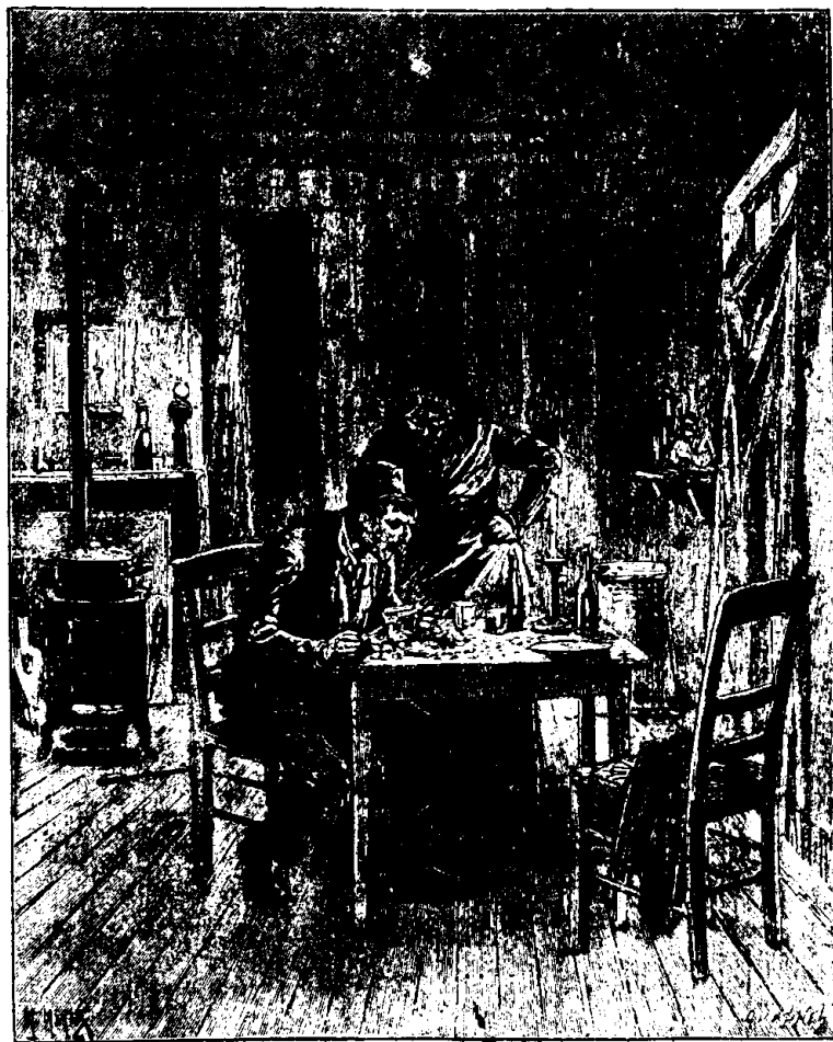
Le soir, on compta la recette.—Page 300, col. 1

Eusèbe et Zéphyrine entrèrent dans un petit établissement, qui arborait fièrement à son fronton une enseigne où l'on voyait un cui-