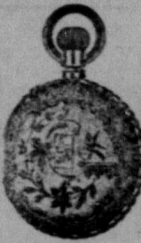
billigare än andra priser parti.

(No-Sew-Allowedance Patterns.) Only 10 and 15 cts. each—more higher. Ask for them. Sold in nearly every city and town, or by mail. THE McCALL CO., 128-148 West 14th St., New York