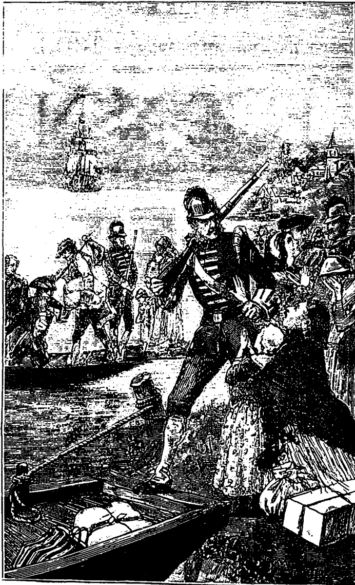
LES ACADIENS CHASSÉS PAR LES ANGLAIS.