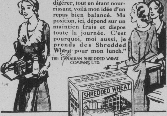
Fait au Canada avec du blé canadien

"Lorsque vous voyez autant de mets que moi dans une journée, vous venez à connaître les choses les meilleures et les plus saines à manger. Remarquez le cabaret de cette jeune fille qui vient de passer à mon comptoir—une boîte de Shredded Wheat et une bouteille de lait entier."