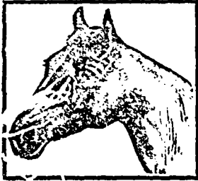
Marque de Fabrique