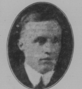
Hon. J. G. Gardiner, der neue Premier von Saskatchewan.

Während der Wintermonate eine Fortbildungsschule und am 1. August 1924 mit einem Vorlesungsbuch nach Saskatchewan. Hier war er als Lehrer in einer Schule bei Regina tätig. Er trat 1911 bei der Saskatchewan Social Party ein und trat 1912 bei der Saskatchewan Liberal Party ein. Er wurde 1913 zum Mitglied der Saskatchewan Legislative gewählt. Er wurde 1914 zum Mitglied der Saskatchewan Legislative gewählt. Er wurde 1915 zum Mitglied der Saskatchewan Legislative gewählt.