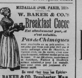
W. BAKER & CO., Distributeurs, 35-37...

chez tous les pharmaciens. Prix, 50¢ et $1.00.