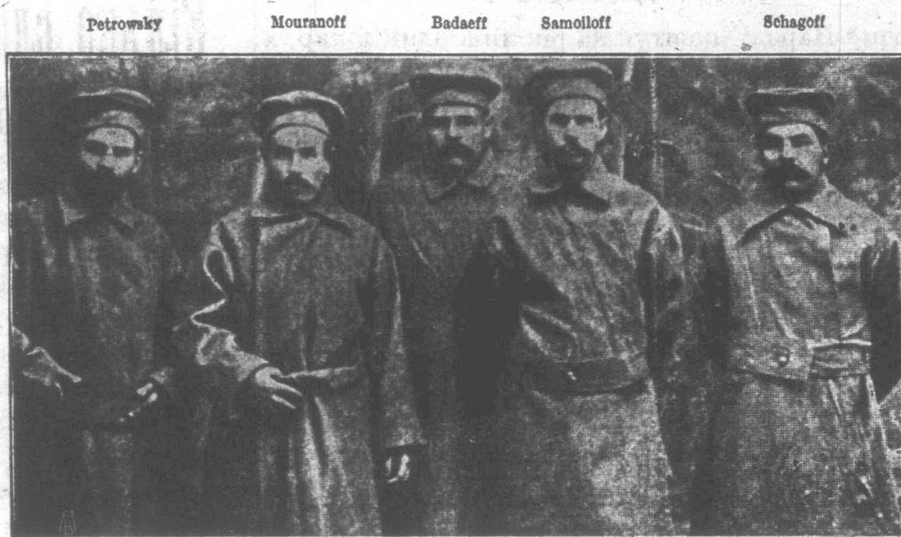
Die für den internationalistischen Kampf gegen den Krieg nach Sibirien verbannten Dumaabgeordneten Sozialdemokraten (Bolschewiki) im Arrestantenkleide. Les députés social-démocrates (Bolschéviki) de la Douma d'empire, déportés en Sibirie pour leur action internationaliste contre la guerre — en habits de galérien. The social-democratic members (all — bolsheviks) of the Duma sent to Siberia for their internationalistic propaganda against war.

Соціалдемократичні послы (всі — большевики) російської Думи, заслані на Сибір за їх интернаціональну пропаганду проти війни. Від лівої руки до правої сто- ять: Петровський, Муранов, Бадаев, Самойлов і Шагов.