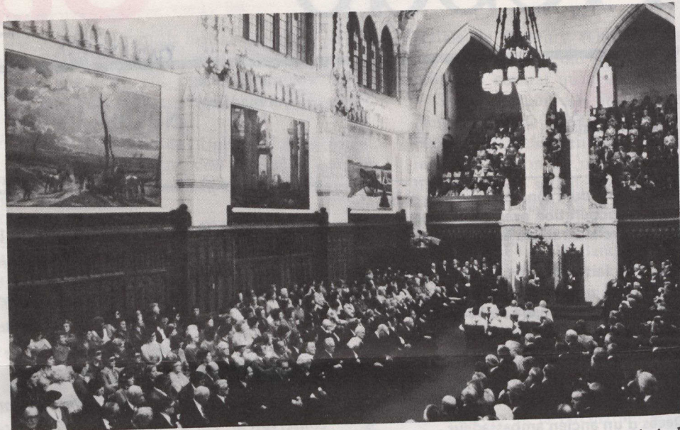
Vue du Sénat pendant la lecture du Discours du Trône. En face du gouverneur général, les membres de la Cour suprême du Canada.

En deuxième lieu, le gouvernement comptera dans une plus grande mesure sur l'initiative individuelle pour la croissance de l'économie et la création d'em-