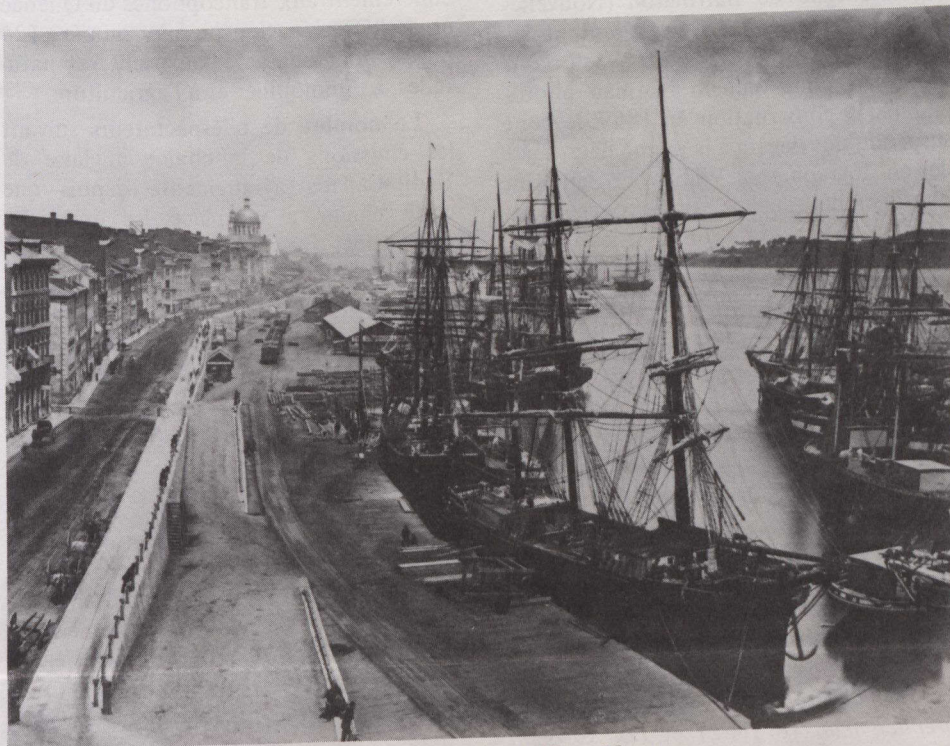
Vue vers l'est du poste de douane, à Montréal, William Notman.

Quatre vingt-neuf photographies de personnages et de scène, témoignages de 70 ans d'histoire du Canada, font l'objet d'une exposition itinérante présentée, du 14 septembre au 11 novembre, à la Galerie nationale du Canada, à Ottawa.