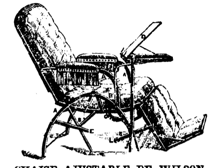
CHAISE AJUSTABLE DE WILSON.

AGENTS DEMANDÉS. $150 par mois. Pour vendre le TINKER [CHAUDRONNIER] l'article de ménage le plus utile qui ait jamais été inventé.