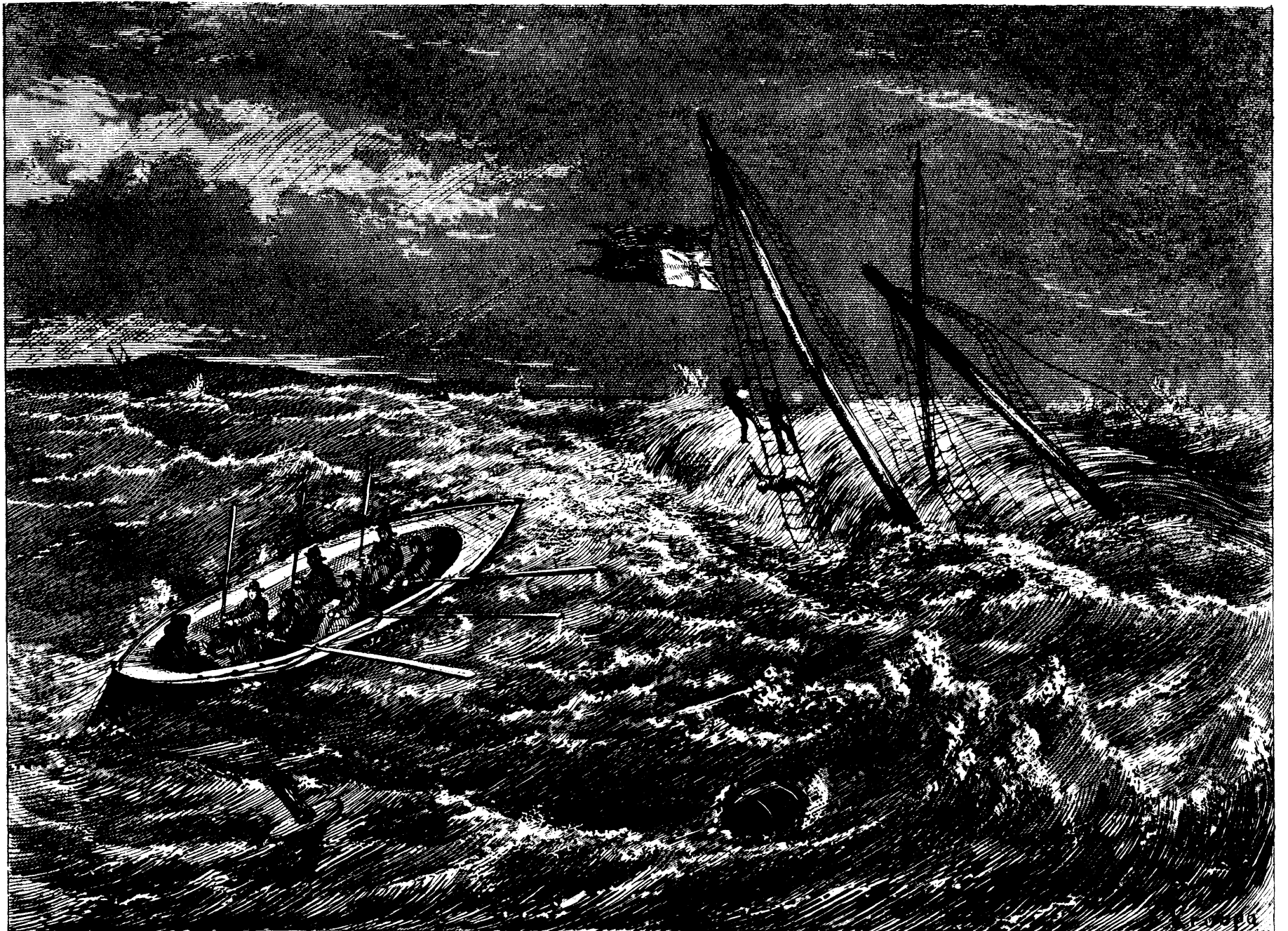
NAUFRAGE À ST. JEAN, NOUVEAU BRUNSWICK.—SAUVETAGE DES SURVIVANTS.