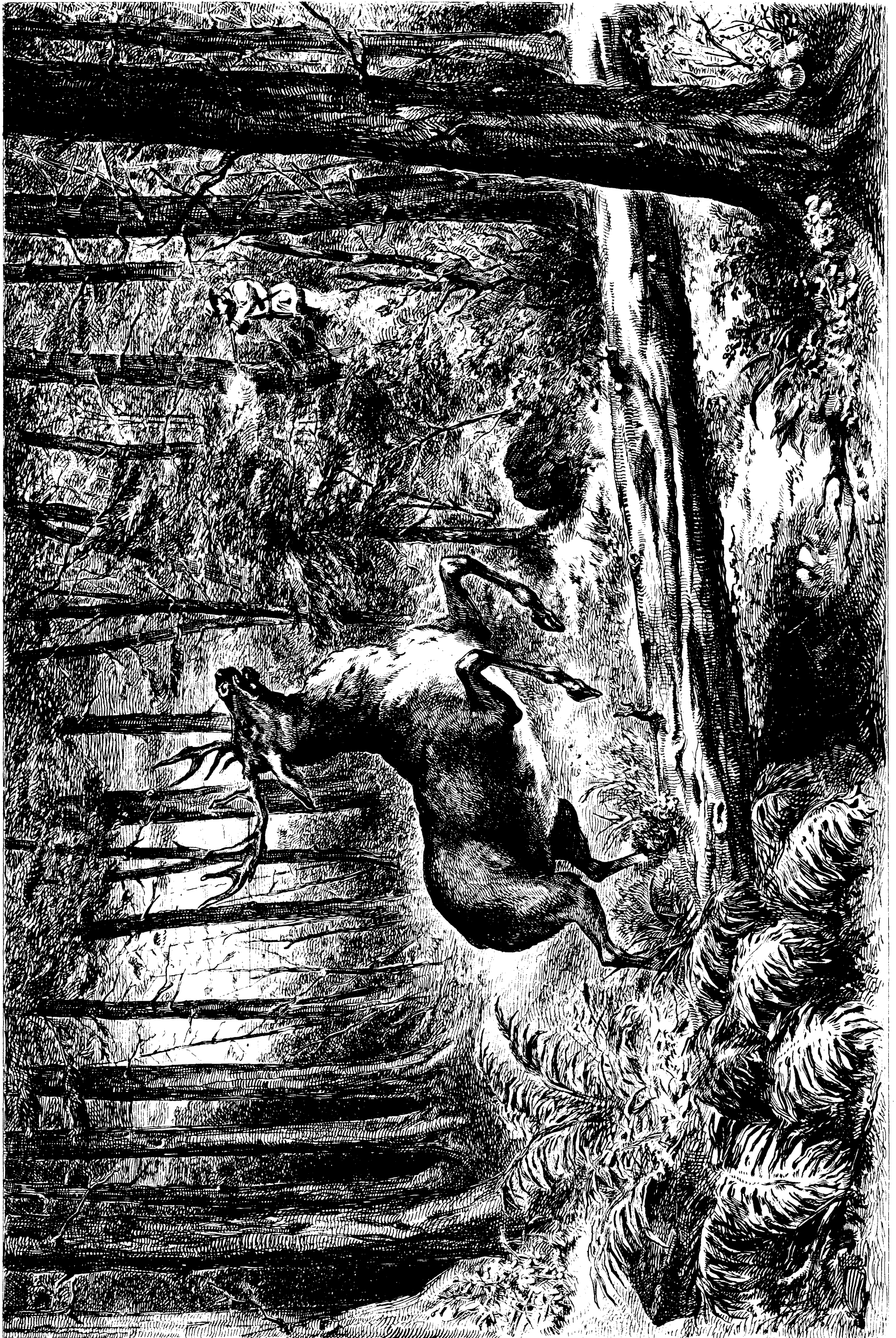
LA CHASSE AU CERF DANS LA FORET CANADIENNE.—LE COUP FATAL.—D'APRES UN CROQUIS PRIS SUR LA PLACE PAR NOTRE ARTISTE.