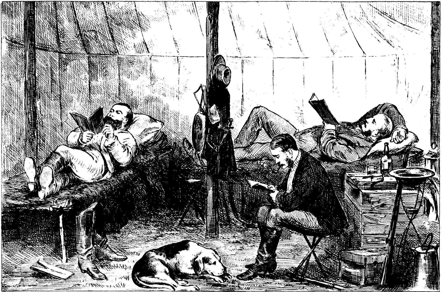
LA CHASSE.—INTÉRIEUR DE LA TENTE UN JOUR DE PLUIE.