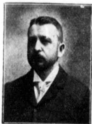
C. E. E. AUTHIER Cercle Olier, No 127. Montre en or (Prix Spécial).

Un écrivain connu par sa... nullité, a fait dernièrement une chute effroyable.