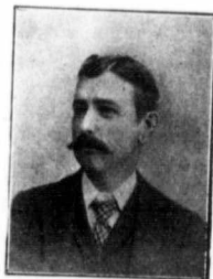
I. MOQUIN, Cercle Olier, No 127. Montre en argent (Prix Spécial).

—Oui, mon ami, lui dit un passant ; seulement ce ne sont pas les écorchés qui crient, ce sont les écorcheurs.