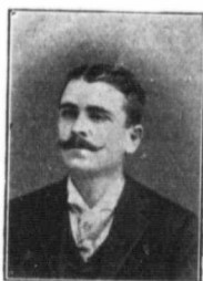
A RIVET, Cercle Hochelaga, No 29. Montre en or (Prix Spécial).

En 1809, au moment d'une insurrection contre la Bavière, des Tyroliens s'étaient emparés de quinze chevaux, après avoir tué les soldats qui les montaient. Ils placèrent ensuite ces animaux dans leurs rangs ; mais lorsqu'à la première rencontre avec les Bava-rois, les chevaux prisonniers entendirent la trompette et reconnurent l'uniforme de leur régiment, il s'élançèrent aussitôt vers celui-ci, emportant de force les cavaliers qui cherchaient à s'opposer à leur volonté, et, qui, à leur tour, furent faits prisonniers.