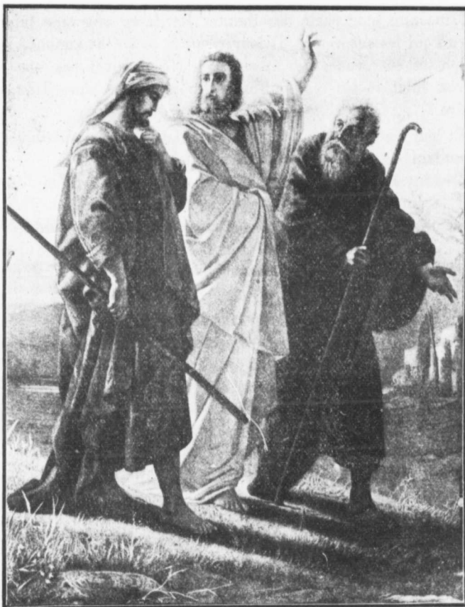
Plockhorst. LES PÈLERINS, D'EMMAÛS

Ils lui répondirent : — Est-il un seul étranger, sortant de Jérusalem, qui puisse ignorer les événements de ces derniers jours ? N'avez-vous pas entendu parler de Jésus de Nazareth,