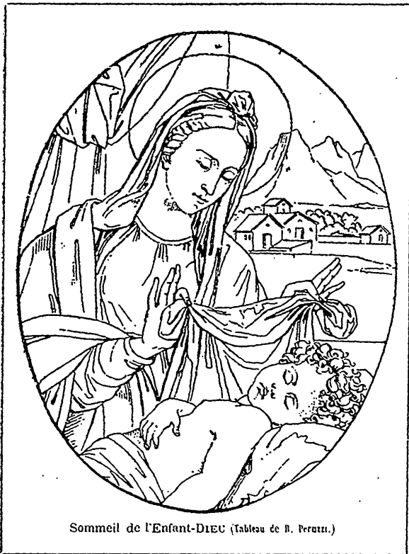
Sommeil de l'Enfant-DIEU (Tableau de R. Peruzzi.)

mères et toute la famille à faire escorte à nos aimables et jeunes communiant. Ils ont un charme qui attire ; mettons ce charme au service de Notre-Seigneur et de