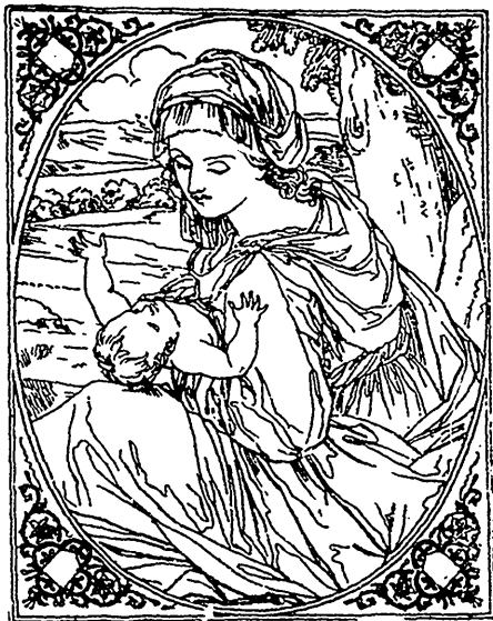
La Vierge et l'Enfant-DIEU (de Pesarese).

Au Lamentin, jamais cérémonie n'eut un éclat pa-