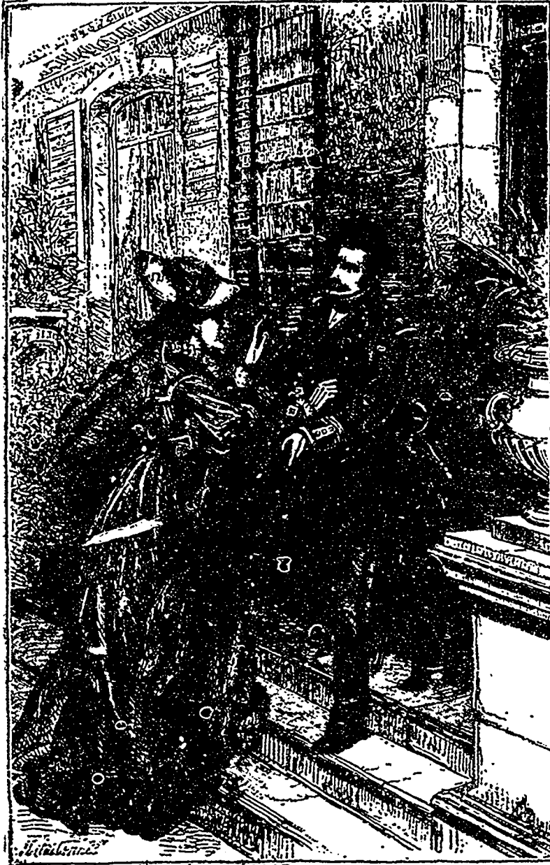
Fleur-de-Mario descendait au jardin lorsqu'elle vit arriver l'enseigne Kilian.