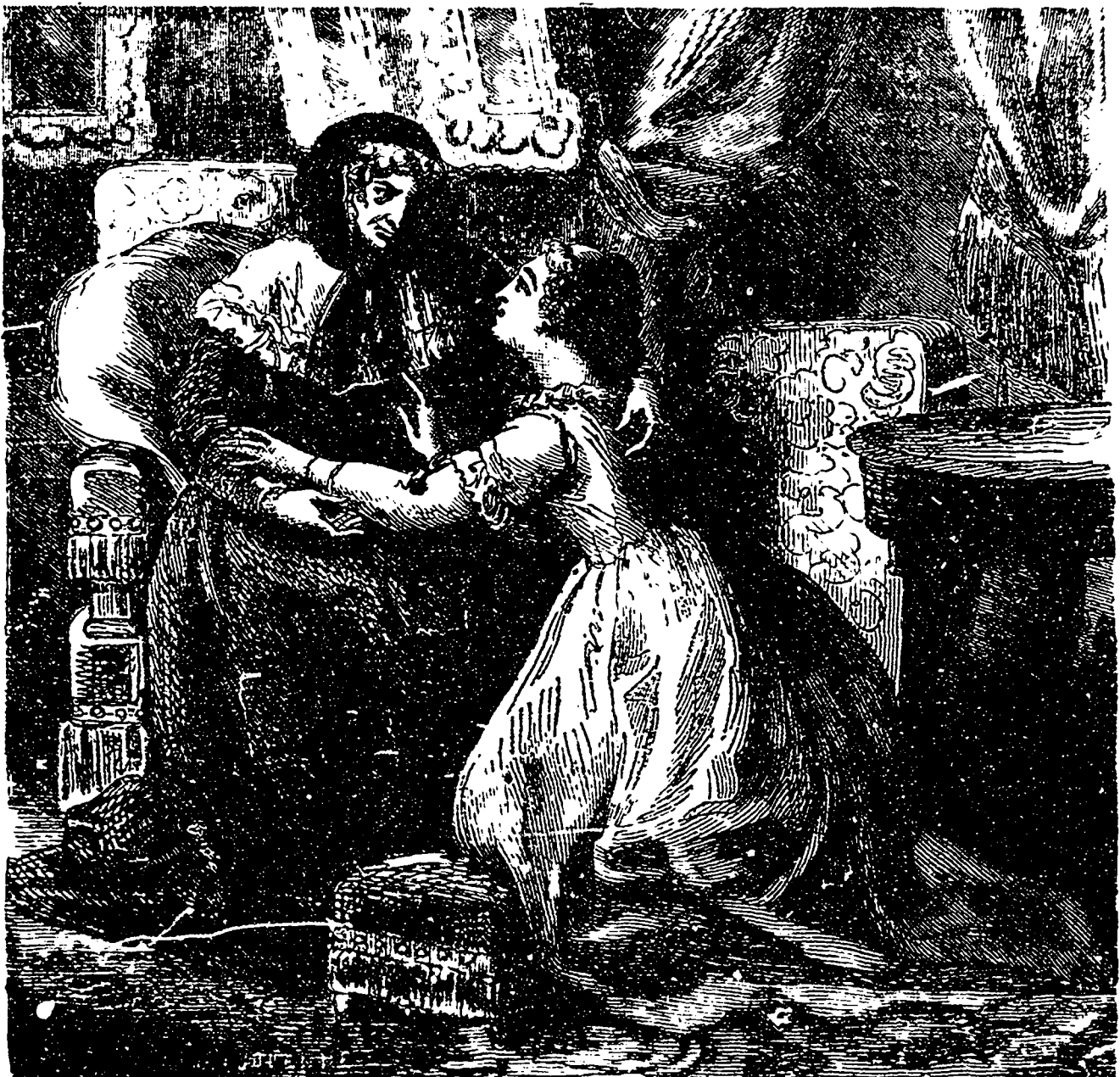
Ce fut seulement en embrassant la marquise qu'elle éprouva de vifs regrets et une profonde douleur.