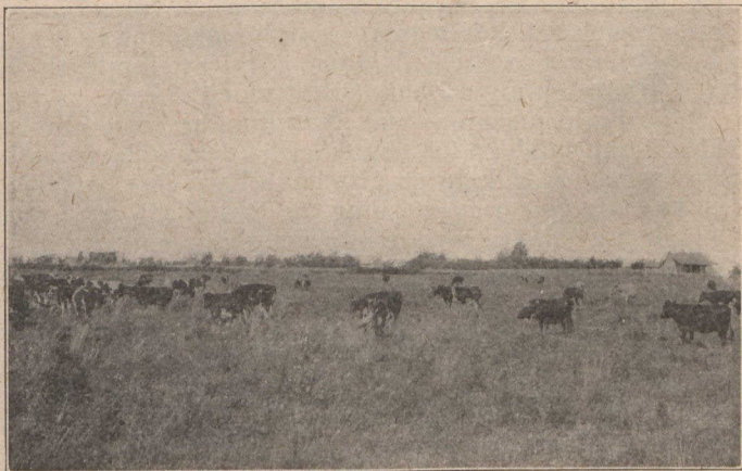
“GU'N D'THUGADH CRODH CHAILEIN DHOMH FAINN' AIR AN RAON.

a' mach fad a Gheamhraidh agus gu bitheanta thig iad troimh gu math air an fheur a' chrìomas iad 'nan ional-traidh laitheil, ach mar ghoireas an aghaidh lath fluich, fiathaich a dh' fhaodas a thighinn gun raghaidh, gun duil ris, tha feur air a ghearradh 's an t-Samhradh agus air a thoirt do 'n fheudail mar a dh' fhaodas feum a bhì air 's a Gheamhradh, no 'san Earrach. Tha moran chruithneachd air a thogail anns a chearnaidh so, mar an ceudna. Tha iomadh aite ann a tha freagaireach airson gràn,