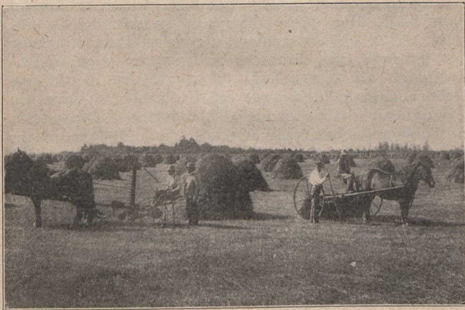
THA GACH SEÒRSA GHOIREAS ACA THUN NA H-OIBRE A LUGHDACHADH.

air—cruithneachd, agus gràn cumanta sam bith; agus gach seòrsa lus. Tha 'n Geamhradh furasd' a' chur seachad; tha sneachd gu leòir a' tuiteam airson an talamh a chomhdachadh gu leir, 'san siol a' dhion o 'n rèòthadh. Mar sin tha 'n cruithneachd a tighinn gu làn abachadh 's an fhoghair agus cha 'n 'eil cruithneachd ri fhaotainn a 'n aite sam bith cho math ris. Cha 'n 'eil teagamh nach bi an duthaich so, ann an uine ghearr, aon de na duthchana a 's beartaiche, 's_a's mò dhaoine