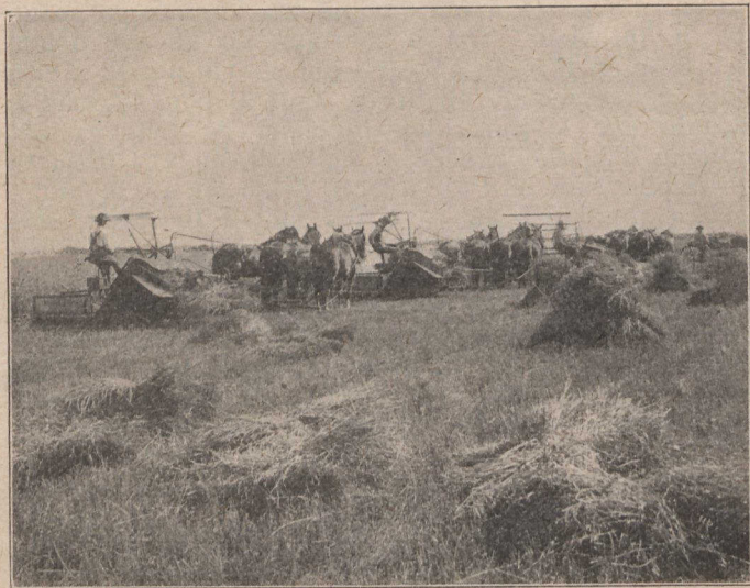
LA FOGHRAIDH ANN AN CANADA.

Tha mòran ghuaill anns a chearnaidh so agus tha coille air na cnuic, air chor 's gu bheil pailteas goireas