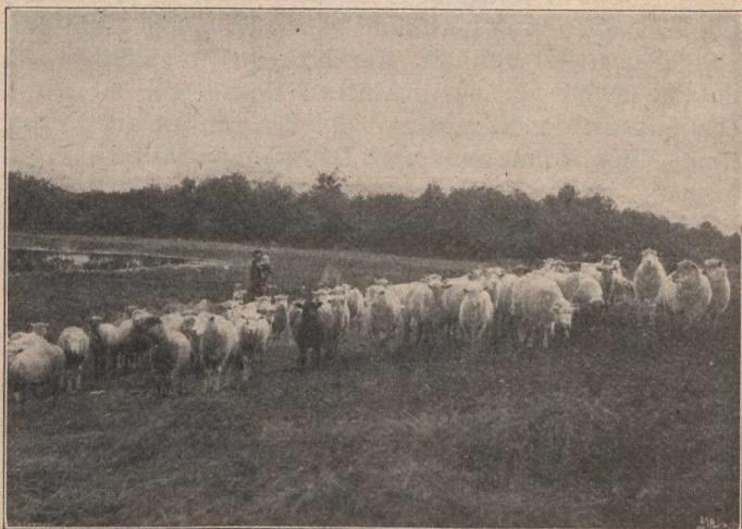
TREUD CHAORACH AIR MACHAIR CHANADA.

Tha 'n aimsir ann an so ro-chiatach gu dearbh. Cha 'n 'eil mòran aitean ann an America cho tlachdmhor ris an aite so a thaobh aimsir. Cha 'n 'eil mòran sneachd idir re a Gheamhraidh; cha 'n 'eil mòr theanndachd rèthaidh; cha 'n 'eil stoirm oilteil de ghaoith no de ghaillionn; agus tha blaths' an t-samhraidh tlà, ciùin, agus measarra. Tha deagh ionaltradh ann airson spreidh, agus tha geamhrachadh pailt airson eich agus chruidh