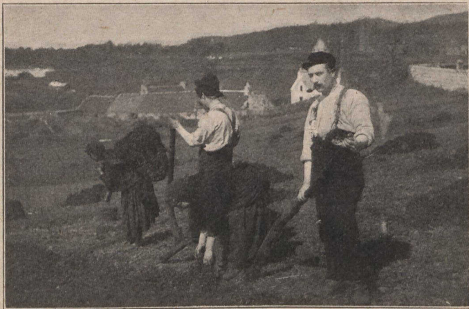
RUARADH LEIS A CHAS-CHROM 'S A GHAIÐHEALTACHD.

Cha 'n urrain fìor Ghaidheal a bhi smaointeachadh air imrich thar chuan, gu tir ainedil, gun a bhi beachdachadh gu durachdach air tir a bhreith 's a chairdean.