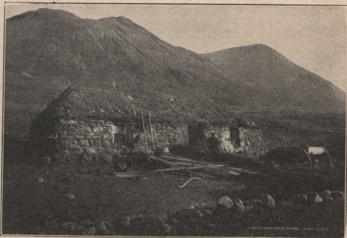
AN TAIGH 'S AN ROBH MI OG.

bithidh e, ach beag, cho furasda dhuit a dhol a choimhead do chairdean bho Chanada 's a bhiodh e dhuit bho Ghlaschu no Lunnain, mar biodh airgid aiseig agad. Agus, a ris, ann an Canada bithidh tu mar a's trice am measg chairdean no luchd-duthcha; am measg muinntir a dheòil cìche am mathar ann an eileanan siar Alba, no anns na siorramachdan Gaidhealach, 's a thug leò gné