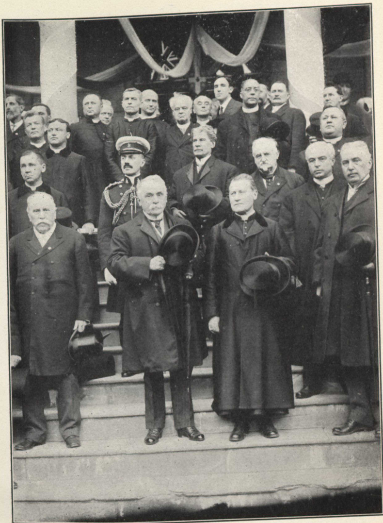
Arrivée du Lieutenant-Gouverneur au Séminaire (page 32).