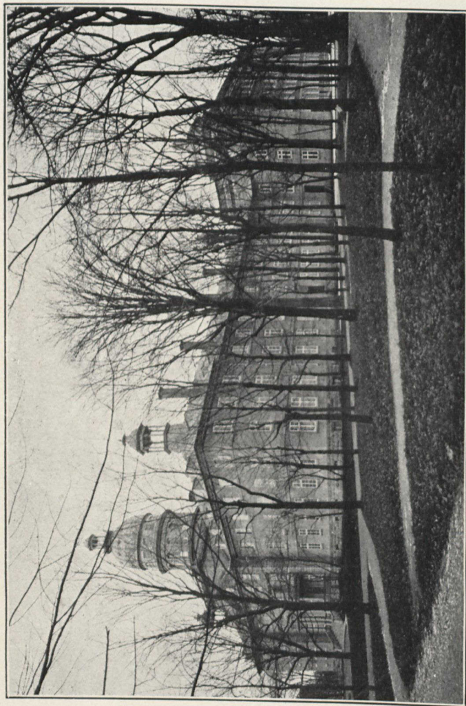
Monument du Centenaire.