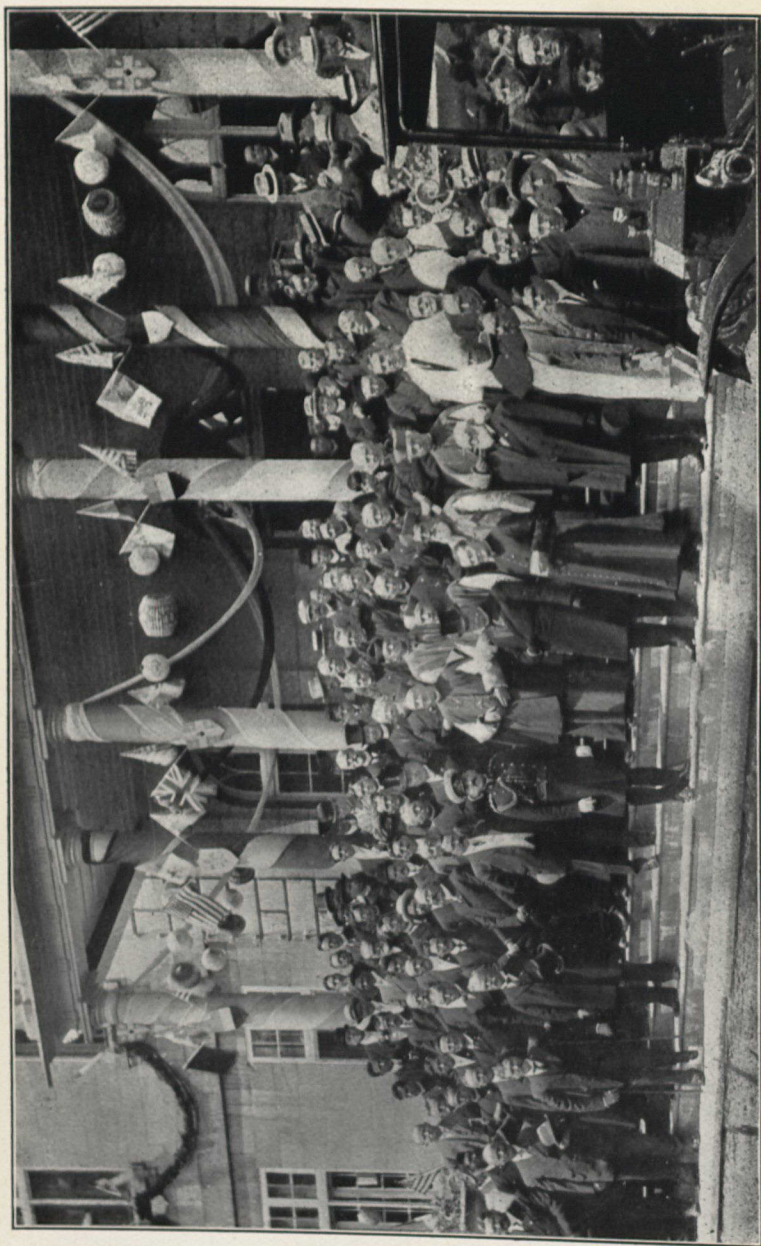
Retour de la messe du Centenaire (page 93),