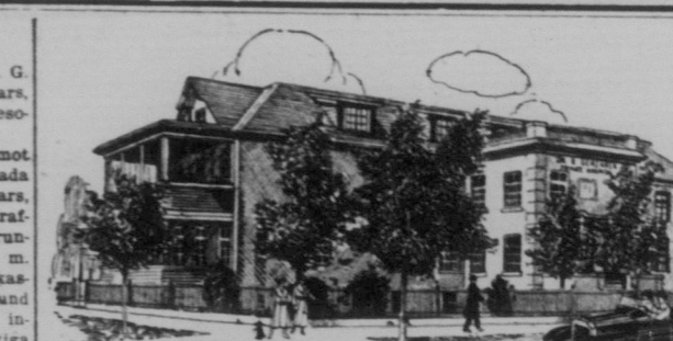
Natt- och dagbehandling av skadade besvaras skyndsamt

Gynna Svenska Canada-Tidningens annonsörer.