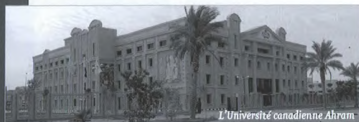
L'Université canadienne Ahram

En Égypte, la famille moyenne consacre environ 40 % de son revenu à l'éducation, et le pays se classe bon premier au Moyen-Orient en ce qui a trait au nombre d'étudiants. Il n'est donc pas étonnant que le marché égyptien des services éducatifs offre d'énormes possibilités aux fournisseurs canadiens.