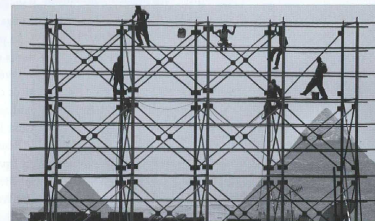
Des travailleurs égyptiens dressent un panneau d'affichage devant la pyramide de Gizeh. L'Égypte a mis en chantier des réformes politico-économiques qui, selon certains, s'imposaient depuis longtemps.

Les progrès accomplis jusqu'à présent ont amélioré la perception qu'ont de l'Égypte les marchés des capitaux internationaux, ce qui a entraîné une progression rapide de l'investissement étranger direct (IED) et des entrées de portefeuilles. Dans une étude consacrée au climat des investissements, le cabinet de placements J.P. Morgan prend note de cette évolution et estime que l'IED devrait