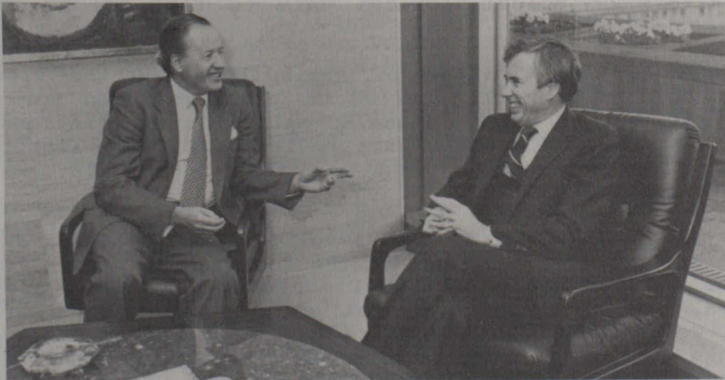
Dr. Mark MacGuigan, Secretary of State for External Affairs, speaking with President Gaston Thorn.