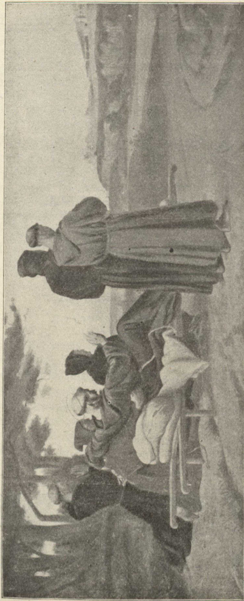
SAINTE FRANÇOIS BÉNÉSSANT ASSISE