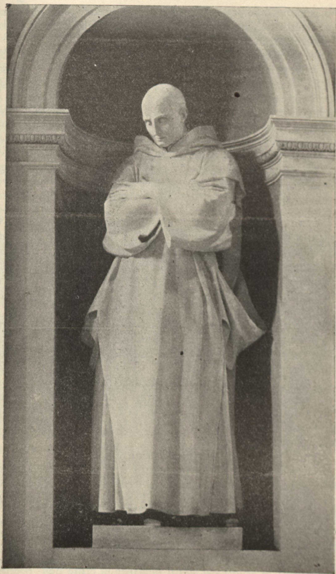
SAINTE BRUNO, FONDATEUR DE L'ORDRE DES CHARTREUX. (D'après une statue.)