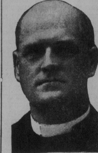
הויפט מיניסטער פון א"ר רעגירונג

ברטישע רעגירונג נייערע צו פארענדיקן פארדאנדלונגען ביי דער קאמיטע יצונג, ווי 29טן (פעניעל פאר דעם אידישן ווארט)