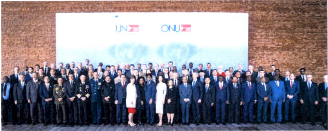
La Réunion des ministres de la Défense sur le maintien de la paix des Nations Unies à Vancouver, novembre 2017.