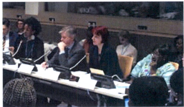
Activistes de la paix du Burundi et du Mali et le Secrétaire général adjoint aux opérations de maintien de la paix lors d’un événement franco-canadienne à la Commission de la condition de la femme des Nations Unies à New York, mars 2018.

1 er objectif : Accroître la participation significative des femmes, ainsi que des organisations et des réseaux de femmes à la prévention, à la résolution des conflits et à la reconstruction des États après les conflits.