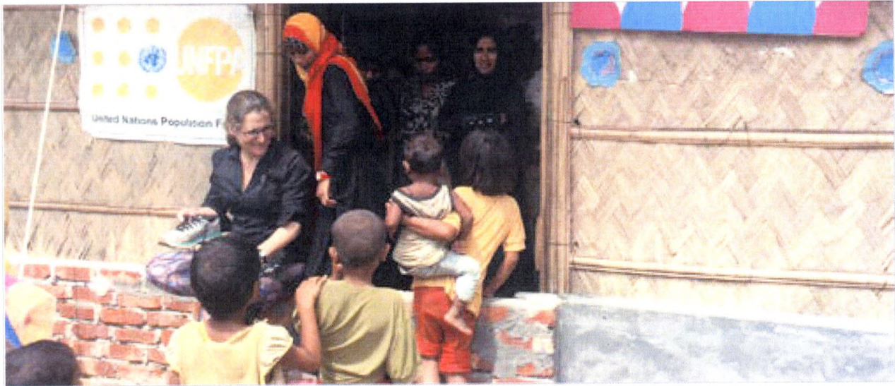
La ministre des Affaires étrangères Chrystia Freeland dans le camp de réfugiés Rohingya, Cox's Bazar, Bangladesh, avril 2018.