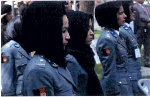
Policières lors de la cérémonie du quartier des policières à Kaboul, avril 2018.