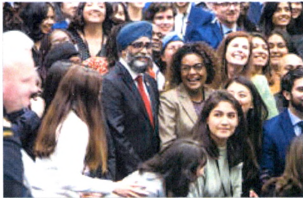
Le ministre de la Défense nationale Harjit Sajjan avec la Secrétaire générale de la Francophonie Michaëlle Jean et des jeunes activistes de la paix à Vancouver, novembre 2017.