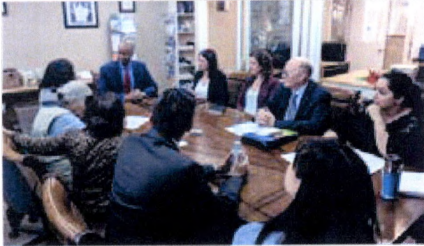
Le ministre de l'Immigration, des Réfugiés et de la Citoyenneté Ahmed Hussen et des organisations de la société civile qui soutiennent les nouvelles venues discutent de l'intégration des femmes immigrées sur le marché du travail.

Le Centre canadien d'engagement communautaire et de prévention de la violence (Centre canadien) a été mis sur pied en juin 2017 pour offrir leadership et soutien dans la lutte contre la radicalisation menant à la violence au Canada. Dans tous ses partenariats, le Centre canadien veille à ce que les efforts faits pour comprendre et prévenir la radicalisation menant à la violence au Canada, et lui faire échec, intègrent les principes du Programme FPS, en consultant divers groupes de citoyens et diverses organisations communautaires; en prêtant attention aux facteurs caractéristiques de risque et de prévention ainsi qu'aux points forts et aux vulnérabilités des diverses collectivités, des familles, des femmes et des jeunes; en intégrant les considérations liées au genre et à la diversité dans la conception, la mesure des résultats et l'évaluation des programmes. En collaboration avec Affaires mondiales Canada, le Centre canadien dirige aussi les efforts internationaux de notre pays dans la lutte contre la radicalisation menant à la violence. Un exemple des résultats obtenus pendant la période visée ici réside dans l'intégration des considérations liées au genre dans les engagements pris par le G7 relativement à la lutte contre la radicalisation menant à la violence. Les politiques reflétant les principes du Programme FPS ont aussi aidé à accroître les efforts pour améliorer l'égalité des