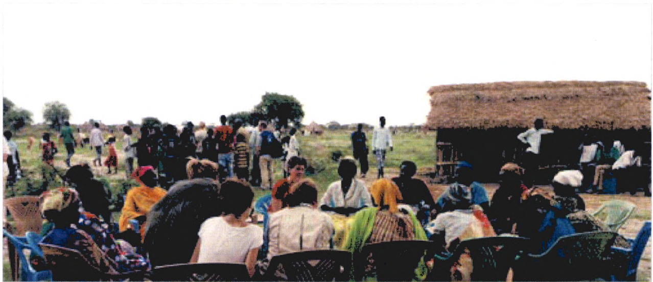
La ministre du Développement international Marie-Claude Bibeau au Soudan du Sud, juin 2017.

« Au Soudan du Sud, des normes et des attitudes sociales et institutionnelles rigides empêchent d'inclure les femmes et leurs droits dans le processus décisionnel local, régional et national. Afin d'aider à surmonter cet obstacle, l'ambassade conjugue le militantisme et les programmes, par exemple en soutenant des organisations communautaires de promotion des droits des femmes dans les efforts qu'elles déploient pour faire valoir ces droits et en travaillant avec des femmes chefs de file cherchant activement à faire en sorte que le processus de paix favorise l'avancement des intérêts des femmes. »