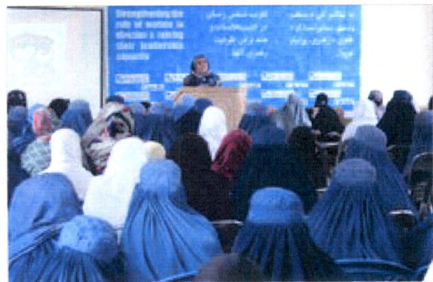
Formation électorale en Afghanistan, avec le soutien du Fonds canadien d'initiatives locales (FCIL).