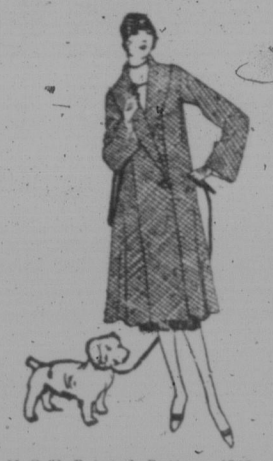
McCall Printed Pattern 4217