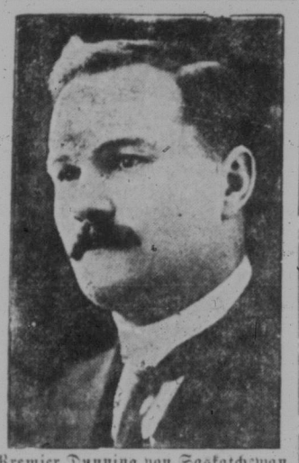
Premier Dunning von Saskatchewan.

Toronto. — Gestern Freitag hatten sich in der Raffles-Halle zu Toronto nicht weniger als 3500 Menschen eingefunden, wozu außerdem des Veranlassungsfalles noch 5000 weitere hinzukamen, die mit Hilfe von Lautverstärkern die Ausführungen der Redner vernahmen konnten. Mit besonderer Begeisterung wurde Premier Dunning von Saskatchewan