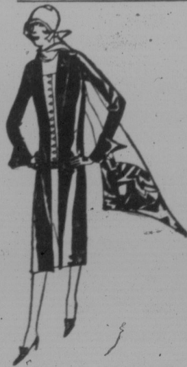
McCall Printed Pattern 4909