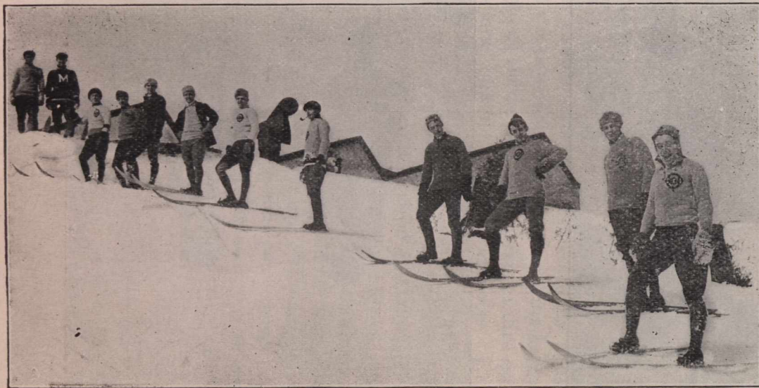
SPORTS D'HIVER A QUEBEC. Sur les fortifications, paradis des Skieurs.