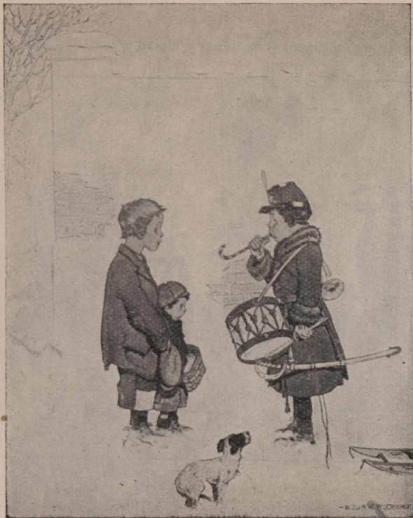
INÉGALITÉ DES FORTUNES. — En fait-il des façons avec sa flûte sacrée ! Laisse essayer un solo, voir !