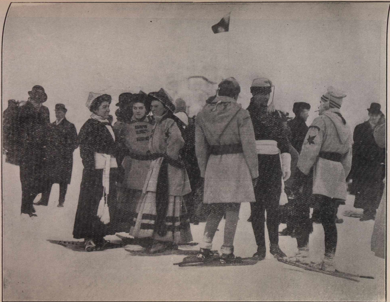
SPORTS D'HIVER A QUÉBEC.—Un groupe de raquetteurs.