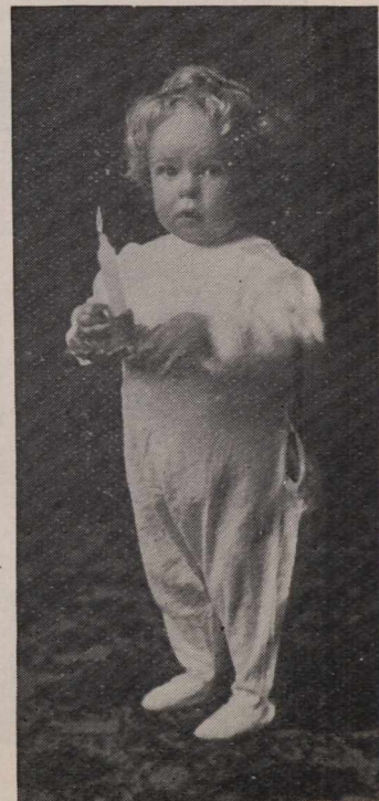
L'AVENIR DU SPORT !