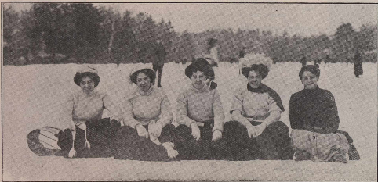
SPORTS D'HIVER A QUÉBEC.—La "traine sauvage" et ses enthousiaste.—" Glissez mortels !..