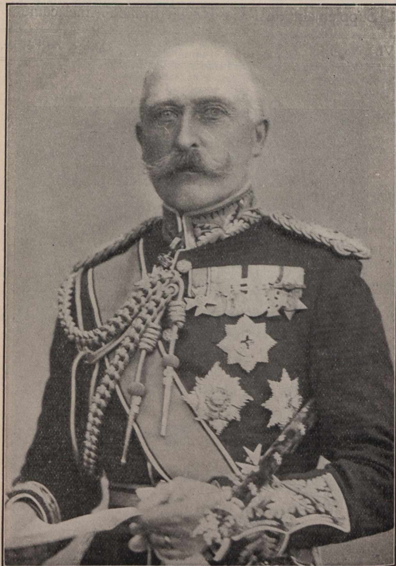
SON EXCELLENCE LE DUC DE CONNAUGHT, Frère du feu roi Edouard VII, il serait le prochain Gouverneur-Général du Canada.