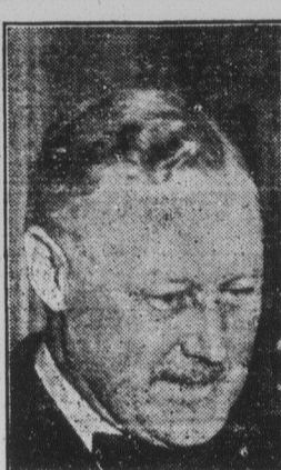
Sir William DAVISON, prominent member of the British House of Commons, who has again introduced a Bill in the Mother Parliament to legalize lotteries. His efforts last year to get lotteries approved for hospitals failed.