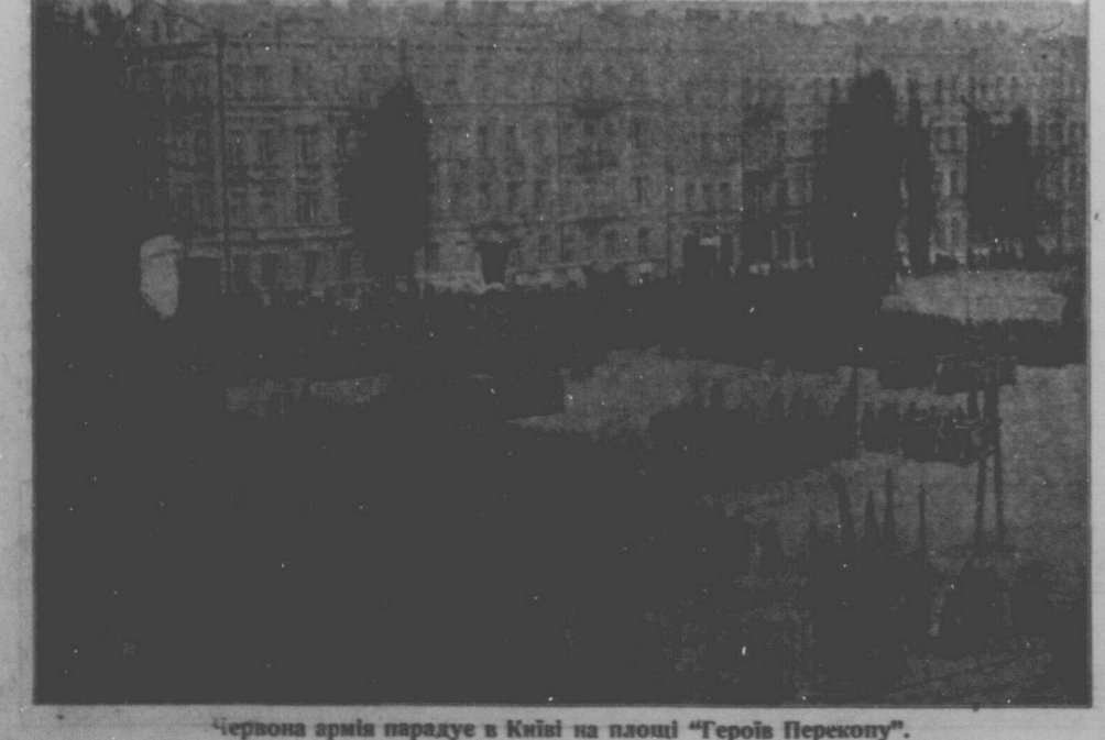
Червона армія парадуює в Києві на площі "Героїв Перемоги".