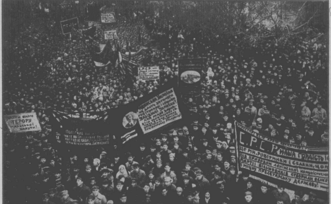
ТІ, ЩО РОЗВАЛИЛИ "ТЮРМУ НАРОДІВ" — СВЯТКУЮТЬ СВОЮ ПЕРЕМОГУ.

режно, по-ленінському, мудро. Зразу і перш за все, всім ясно стало, що не окремі нації повинні ворогувати між собою, а класи. Дві класи: клася трудящих і клася капіталістів. Трудящі і нероби. Бо ця ворожнеча споконвічна: капіталіст-єврей — ворог трудящому робітникові єврейові. Український пан-поміщик корог українському селянинові біднякові. Руський купець чи фабрикант — ворог і п'явка руського фабричного робітника. І українському селянинові не миліший поміщик від того, що він українець, так само, як єврей-робітникові не миліший його хазяїн-капіталіст від того тільки, що він єврей. Одна мета у всіх трудящих — то байдуже, з якого воли народу, чи то будуть вони французи, чи українці, чи татари, чи євреї, — мета одна — це подолати у спільній боротьбі капітал і доходити нового соціалістичного життя. Це основна мета всіх трудящих. За неї борються комуністична партія у всьому світі.