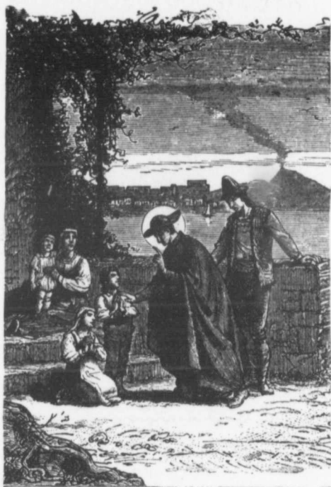
SAINTE ALPHONSE-MARIE DE LIGUORI 2 Août.

Alphonse-Marie de Liguori, né à Naples, le 27 septembre 1696, était l'un des plus brillants avocats de cette ville. Il renonça au monde, prit l'habit ecclésiastique et se livra avec ardeur à l'étude de la théologie, des Saintes Ecritures et des Pères.