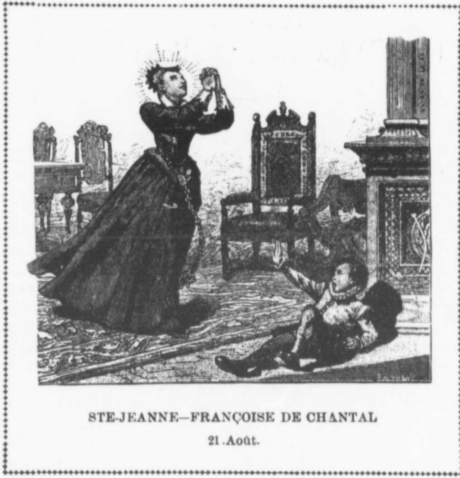
STE-JEANNE-FRANÇOISE DE CHANTAL