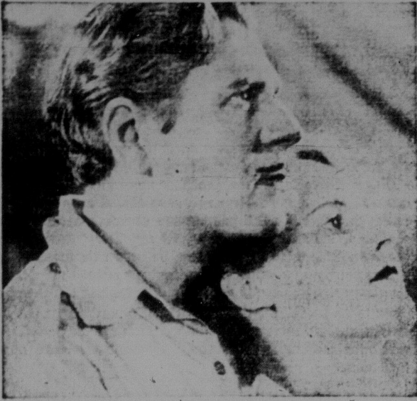
WARNER BAXTER and LOIS MORAN in "BEHIND THAT CURTAIN"

В ПЯТНИЦЮ 28 БЕРЕЗНЯ, ВІД ГОД. 8.30 ВЕЧЕРОМ В СУБОТУ 29 БЕРЕЗНЯ, ВІД ГОД. 7-ОЇ ВЕЧЕРОМ