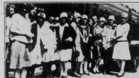
"Гуд-бай" Торонто! — На станції в Торонто перед від'їздом.

От ми й чекали, визирали, та все вивідували, де Д.М.О. сьогодні го-ститься, а де буде завтра, позавтра, і так через шість днів. В кінці чужою, що Д.М.О. в Садборі на пішкю го-сподиною виїхала, а зі Садбори до Торонто, Монреалю, Оттаві й врешті й до нас, але хіба десь аж під кінець серпня, і то ще не певно.