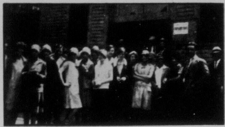
Мандоліністки перед Інтернаціональним Робітничим Домом в Гемтремі, в Заулевіх Державах Америки.

Не забувай про тих дорогих, радісних хвилини, бадьорих настроїв і всіх веселощів, що їх переживав враз із всім свідомим українським робітничеством цієї місцевості з нагоди приїзду до нас славної Дівочої Мандолінової Оркестри з Вінніпегу. Та не лише славної, а й дуже-дуже дорогої нам оркестри, що на самому злагоді по неї кожному українському робітникові й робітничій чотирці радісно стає на серці, немовби для них це раз вернувся їх дитячий світ з тими милолюбними мріями й надіями.