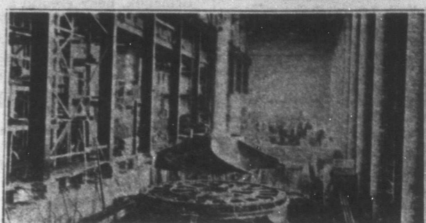
Szerelik a Rabszolga vízesések természeti erejéből villa- mosságot alakító turbinákat. A képünkön látható 5 láb át- mérőjű forgórész fölé helyezik majd az áramfejlesztő dina- mót, közvetlenül kapcsolva a turbina két láb átmérőjű acéltengelyével. Egy-egy ilyen turbina egy egész kis város részére képes elegendő villamos áramot szolgáltatni.