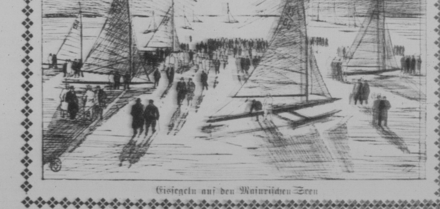
Gisegeln auf den Wäldchen Seen

Nach im Winter ist Ostpreußen schön! Die Wintersportgebiete in Ostpreußen sind sehr schön. Die Wintersportgebiete in Ostpreußen sind sehr schön.