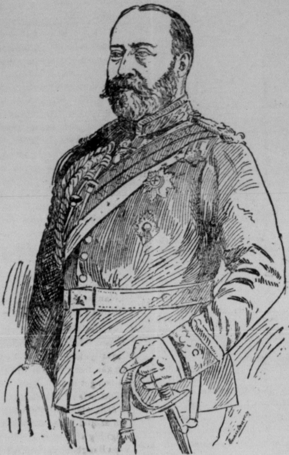
KONUNG EDWARD VII.

Drottning Victorias begräning äger rum om lördag den 2dra februari. En stor sjöpartia kommar att äga rum vid tillfället och de flästa kända hufvudens ombud i Europa väntas närvara.