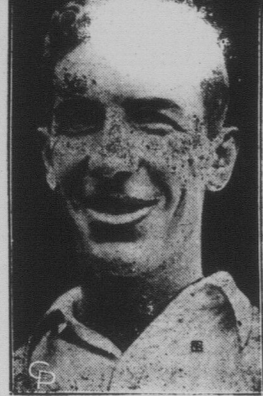
ROSS "SANDY" SOMERVILLE With the British Amateur golf crown as his goal, Ross Somerville, of London, Canadian and U.S. amateur.