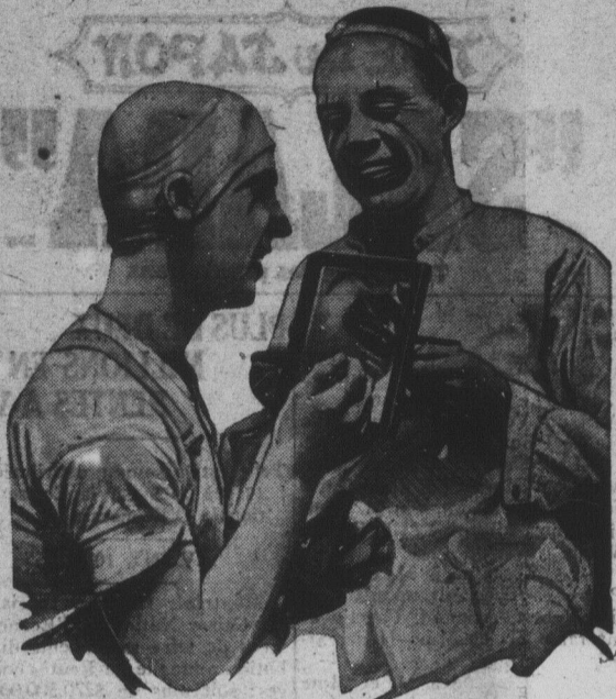
Ce Cirque vient ici cette année avec une physionomie tout à fait nouvelle