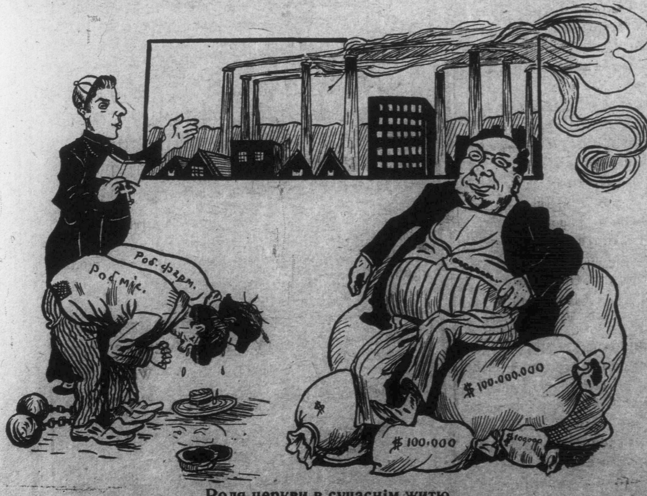
Роля церкви в сучаснім житю.

Читайте і ширіть одиноку робітничу часопись „Робочий Народ“.